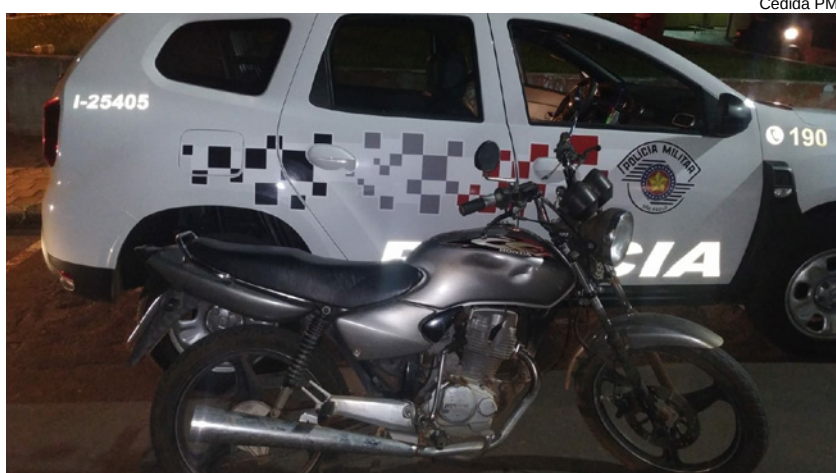
A motocicleta foi em frente ao Ginásio de Esportes com a utilização de uma chave micha