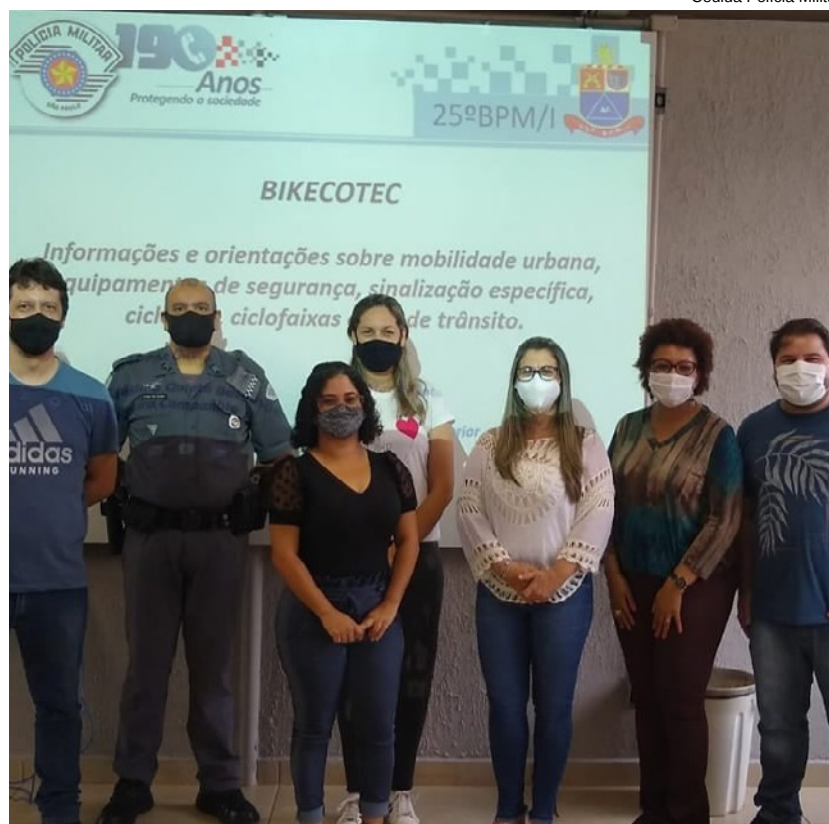
A palestra ocorreu nesta quinta-feira