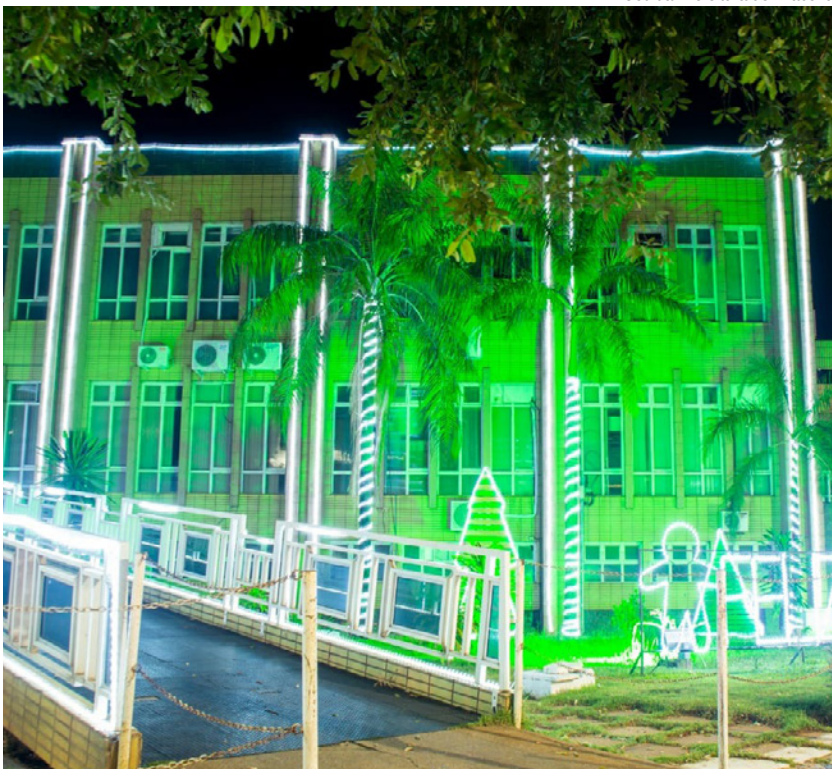
A cidade está em clima natalino