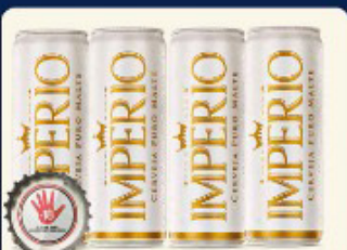
CERVEJA IMPÉRIO PURO MALTE 350 ML LATA