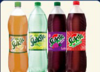
SUKITA 2 LT. SABORES PET "LARANJA, LIMÃO, UVA, TUBAINA"