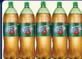
GUARANÁ FUNADA 2 LTS. PET