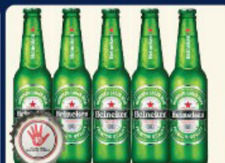
CERVEJA HEINEKEN 330 ML. LONG NECK