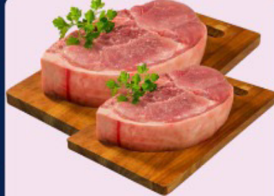
PERNIL SUINO COM OSSO KG.