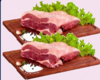
CAPA DO CONTRA FILÉ KG.