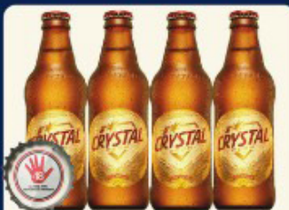
CERVEJA CRYSTAL 300 ML. "TRAZER VASILHAME"