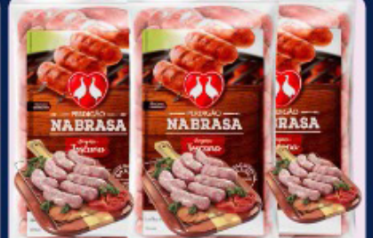
LINGUIÇA PERDIGÃO NA BRASA A GRANEL KG