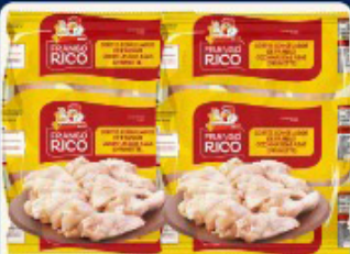
COXINHA DA ASA FRANGO RICO KG.