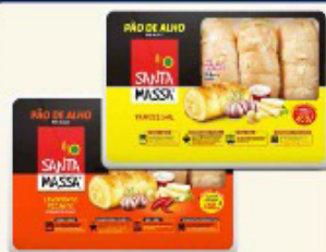
PÃO DE ALHO SANTA MASSA 400 GR. "TRADICIONAL/PICANTE"