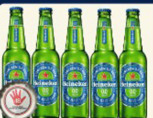
CERVEJA HEINEKEN 330 ML. 0,0 ZERO ALCOOL LONG NECK