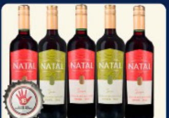
VINHO NATAL 750 ML. "1 TINTO SUAVE/SECO"