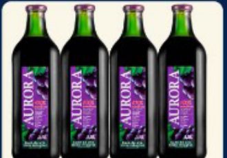
SUCO UVA AURORA 1,5 LT. GARRAFA