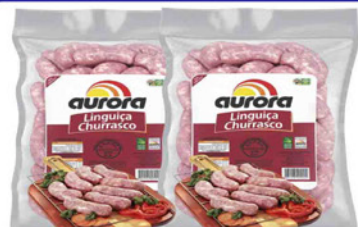
LINGUIÇA TOSCANA AURORA CHURRASCO KG.