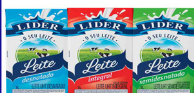
LEITE LONGA VIDA LIDER 1 LT. T.P. "INTEGRAL, DESNATADO, SEMI DESNATADO"