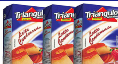
LEITE CONDENSADO TRIÂNGULO 395 GR. T.P.