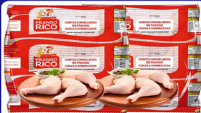
COXA E SOBRECOXA FRANGO RICO KG.