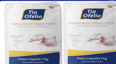
FARINHA DE TRIGO TIA OFÉLIA 1 KG. PACOTE