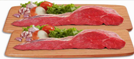
ALCATRA COM MAMINHA KG.

NAS COMPRAS VARIADAS ACIMA DE R$ 70,00 MEDIANTE APROVAÇÃO DE CADASTRO