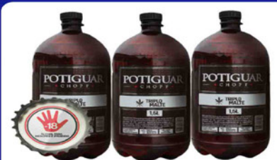
CHOPP POTIGUAR TRIPLO MALTE 1,5 LT. PET