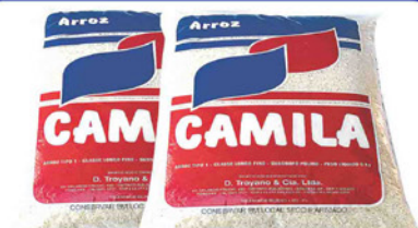
ARROZ CAMILA TIPO 1 AGULHINHA 5 KG. PACOTE