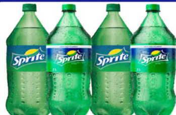
REFRIGERANTE SPRITE 2 LT. NORMAL/ZERO PET