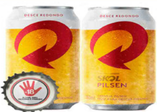
CERVEJA SKOL PILSEN 350 ML. LATA