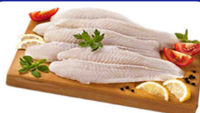
FILÉ DE MERLUZA À GRANEL KG.