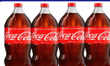
REFRIGERANTE COCA COLA 2 LT. PET