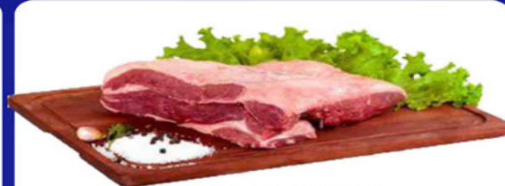
CAPA CONTRA FILÉ KG.