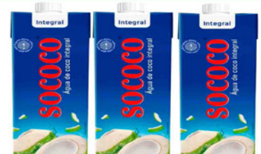
ÁGUA COCO SOCOCO 1 LT. T.P.