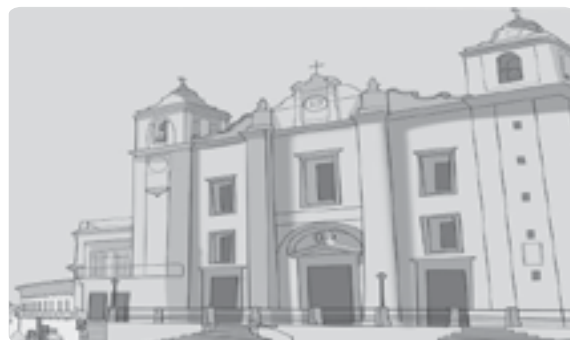
ILUSTRAÇÃO: LUZIMAR LAVES

Localizada a cerca de 130 quilômetros de Lisboa, ÉVORA é a capital do DIS-TRITO de mesmo nome, que fica na região portuguesa do ALENTEJO . Devido às diversas construções históricas e MONUMENTOS , é conhecida como “cidade-museu” e atrai grande número de turistas, sendo, muitas vezes, comparada a Florença, na Itália, e a Sevilha, na Espanha, embora nunca tenha perdido sua identidade LUSITANA . Declarada Patrimônio Mundial da Humanidade pela Unesco em 1986, Évora contém em seu CENÁRIO igrejas, praças e diversos outros locais de RELEVÂNCIA histórica e arquitetônica espalhados por suas ruas estreitas e SINUOSAS , e a maior parte das ATRAÇÕES fica dentro das MURALHAS da Cidade Velha. Por ter sido dominada por diferentes POVOS ao longo de sua história, cada monumento evoca determinado PERÍODO . A época do ano mais recomendável para VISITAR a cidade é na primavera, já que no verão a região do Alentejo apresenta temperaturas muito elevadas.