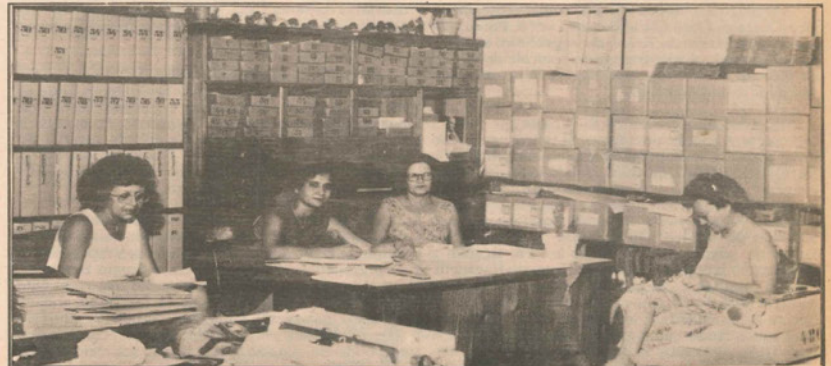
A foto mostra funcionárias do cartório eleitoral no plantão de domingo.

150 pessoas. O movimento durante o período de plantão foi grande e os partidos ganharam prazo de 3 dias para aprovação ou não dos nomes após a filiação. O diretor do cartório explicou que os partidos de Dracena e Ouro Verde entregaram novas fichas durante a semana e até no próprio domingo.