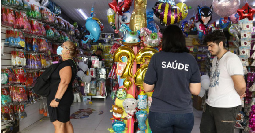
Setor de serviços foi o que mais contratou, abrindo 134.024 empregos