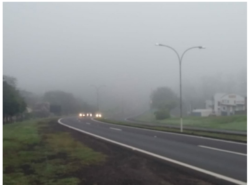
Neblina em Dracena pela manhã