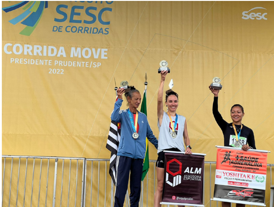
A atleta conquistou o terceiro lugar