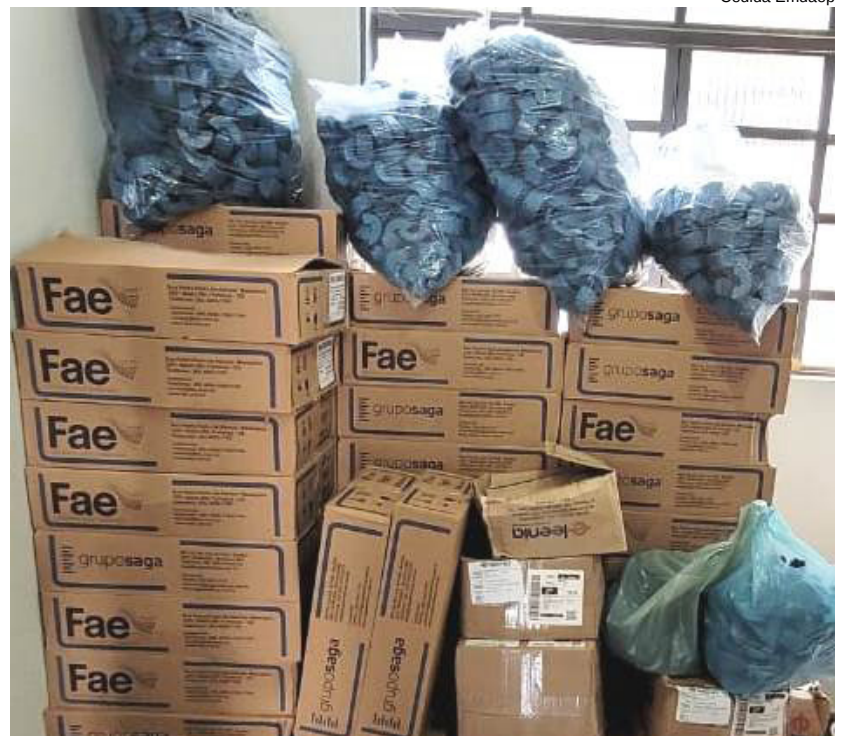
Empresa contratada pela EMDAEP iniciou a troca de hidrômetros que apresentam problemas de funcionamento