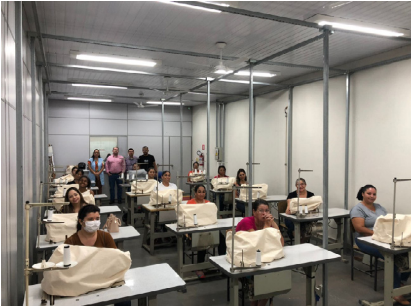
Serão 3 turmas ao longo de 6 meses do curso gratuita, nas instalações do SENAI