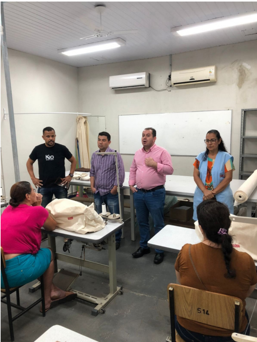
O curso tem por objetivo capacitar mão de obra especializada para o mercado de trabalho