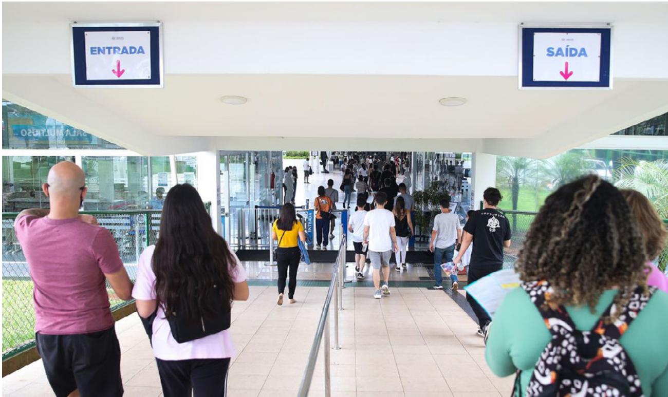
Os exames ocorrem nos dias 13 e 20 de novembro