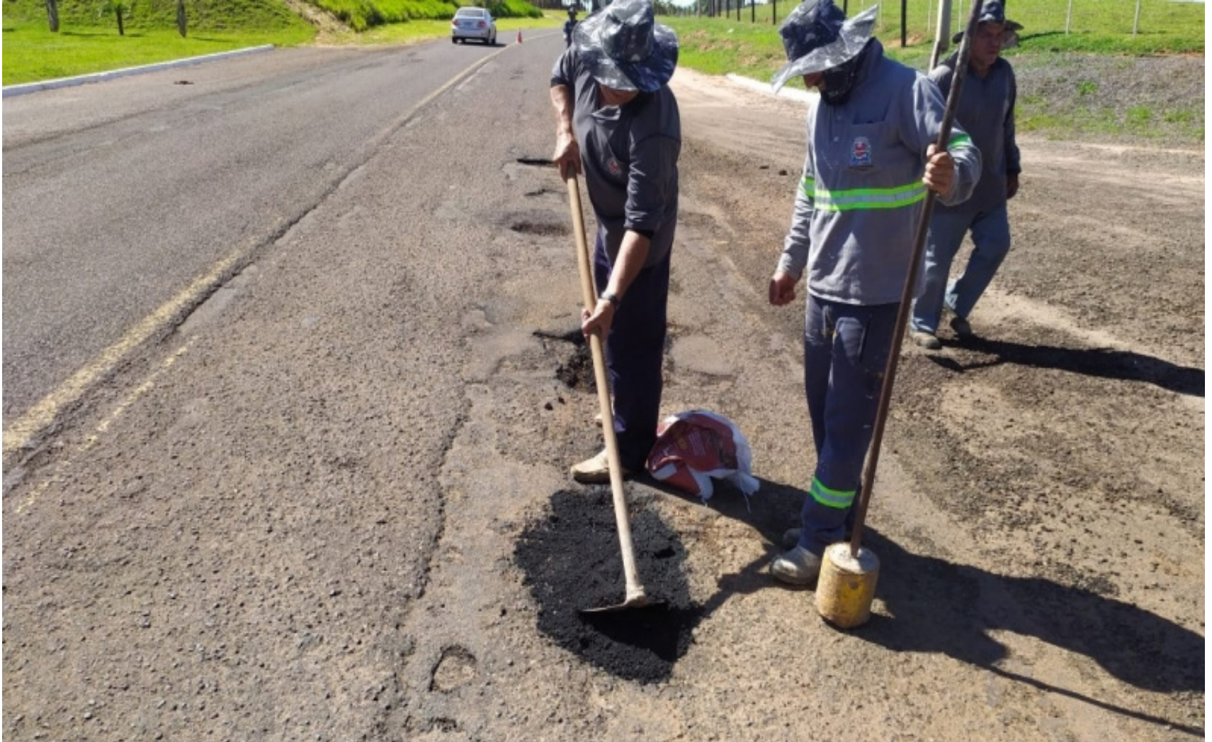
A equipe trabalhava na vicinal do Oásis