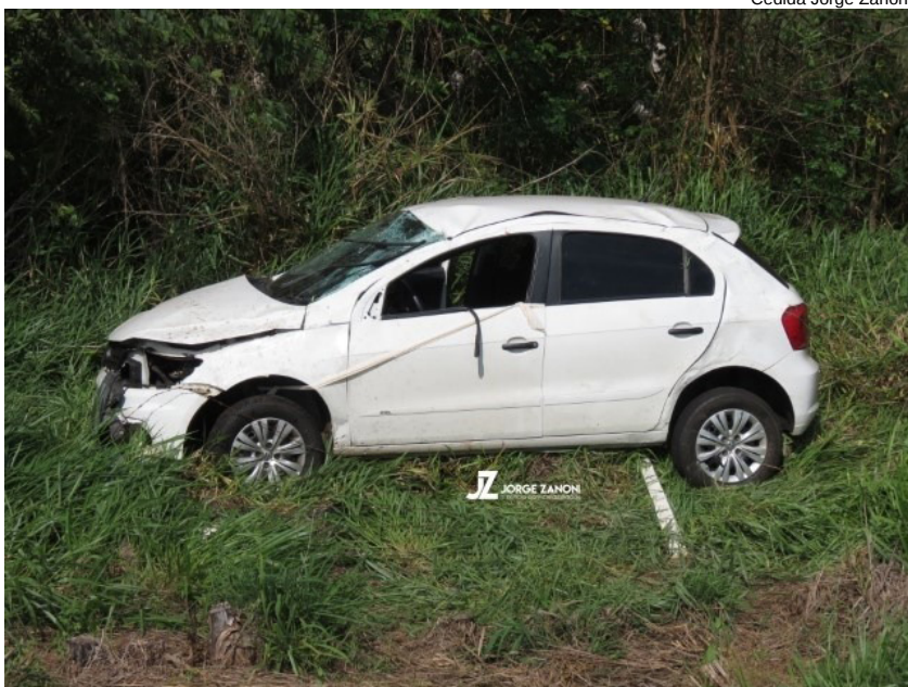
Veículo Gol envolvido no acidente