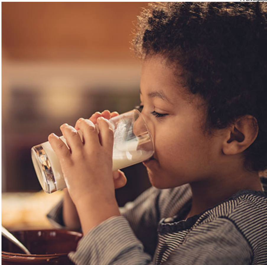
O leite é importante para todas faixas etárias

idade, o cálcio presente em sua composição participa na formação dos ossos e dentes. O consumo de leite deve ser mantido para suprir as necessidades minerais do organismo, mesmo depois dessa fase. Na adolescência, ao fortalecer os ossos que estão sendo formados até aproximadamente os 30 anos de idade, o consumo previne a osteoporose no futuro. Depois dos 30 anos de idade há uma perda natural de cálcio e para a manutenção da vida saudável é necessário que a alimentação rica em cálcio permaneça.