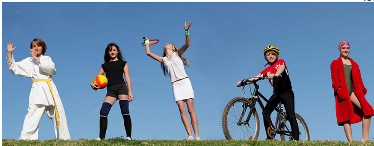
Atividades físicas auxiliam no ritmo acelerado dos jovens no dia-a-dia

As atividades físicas melhoram a qualidade de vida, diminuindo a ansiedade e o estresse.