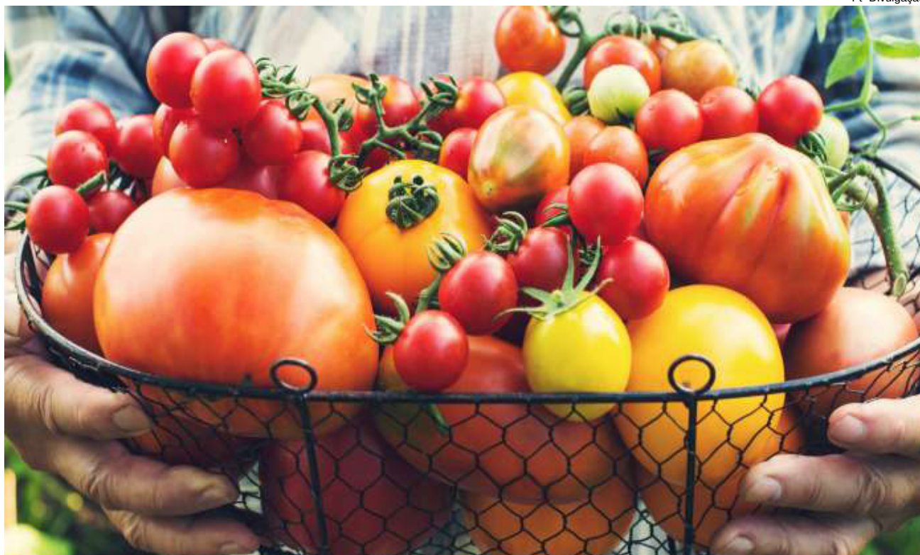
Alimentos orgânicos são produzidos sem uso de produtos químicos

Os alimentos orgânicos favorecem o organismo e ainda o meio ambiente, pois são isentos de qualquer tipo de adubo químico bem como pesticidas. Também não utilizam sementes transgênicas para o cultivo, já que nessa especialidade alimentícia o produtor não pode modificar as características reais do solo e do meio a serem