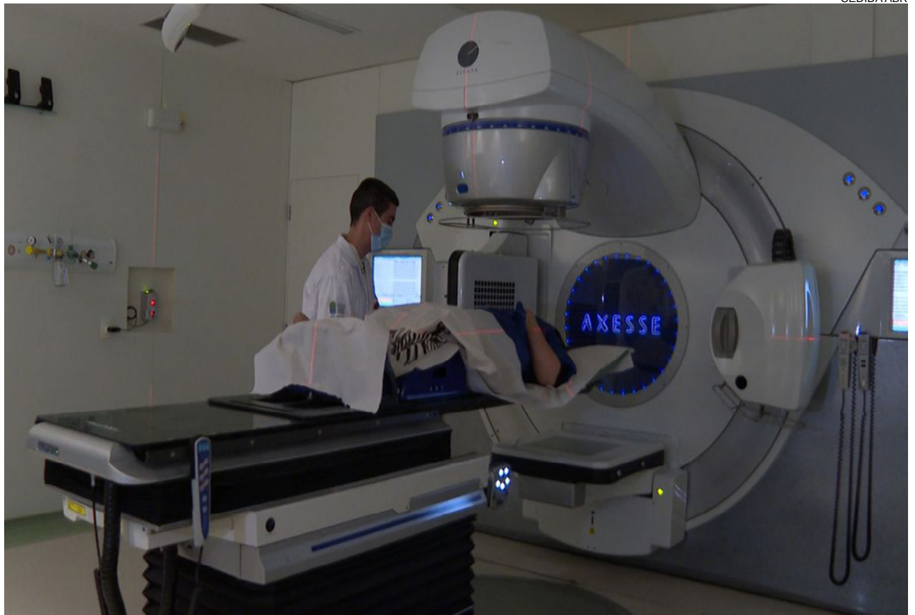
ANS torna obrigatório aos planos de saúde novo remédio contra a asma e três medicamentos contra o câncer

Carcinoma- O Niraparibe é usado em terapias de manutenção de pacientes adultas com carcinoma de ovário, da trompa de Falópio ou peritoneal primário avançado de alto grau, que responderam completamente