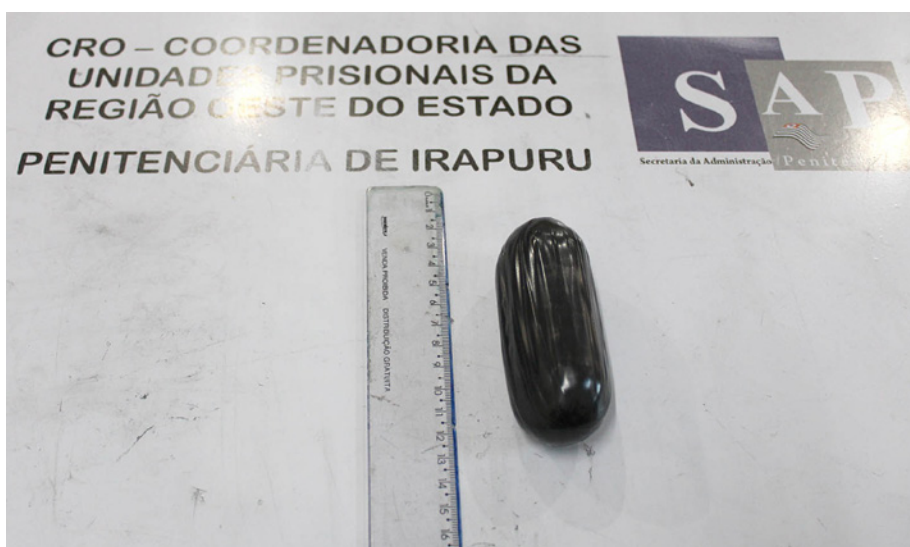
Irapuru: micro celular

visitante foi suspensa do rol de visitas e foi, juntamente com o material, conduzida pelas autoridades policiais ao Plantão Policial Civil em Adamantina..