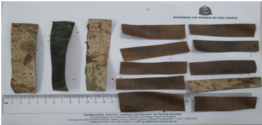
Droga sintética M4, encontrada com visitante na Penitenciária de Flórida Paulista