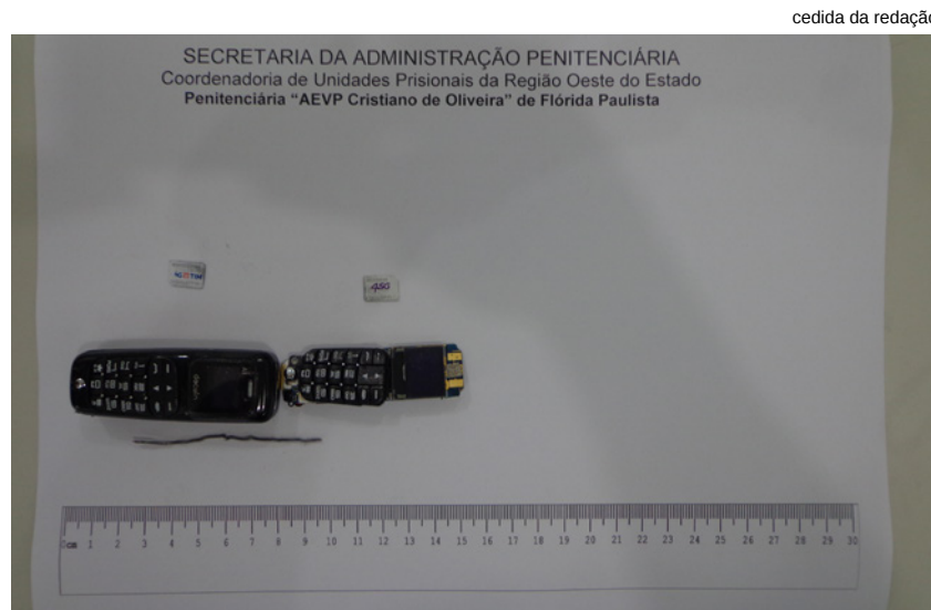
Flórida Paulista: microcelular

Diante dos fatos, as visitantes foram suspensas do rol de visitas e colocadas à disposição da Polícia Judiciária. Os sentenciados foram encaminhados preventivamente ao Pavilhão Disciplinar e responderão a procedimento interno instaurado para apuração de possível cumplicidade.