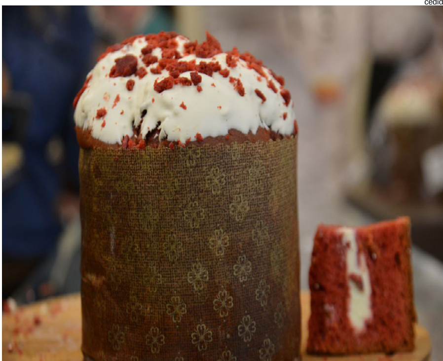
Procon orienta que consumidor planeje o cardápio da ceia para evitar gastos desnecessários

A equipe de pesquisas da Escola de Proteção e Defesa do Consumidor,