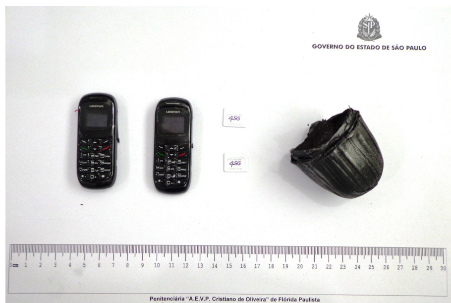
Penitenciária de Flórida Paulista

através do aparelho de scanner, quando submetida a procedimento de revista padrão da unidade prisional.