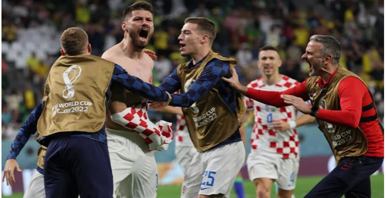
A Croácia conseguiu fazer o que sempre fez, eliminou mais uma seleção nos penais