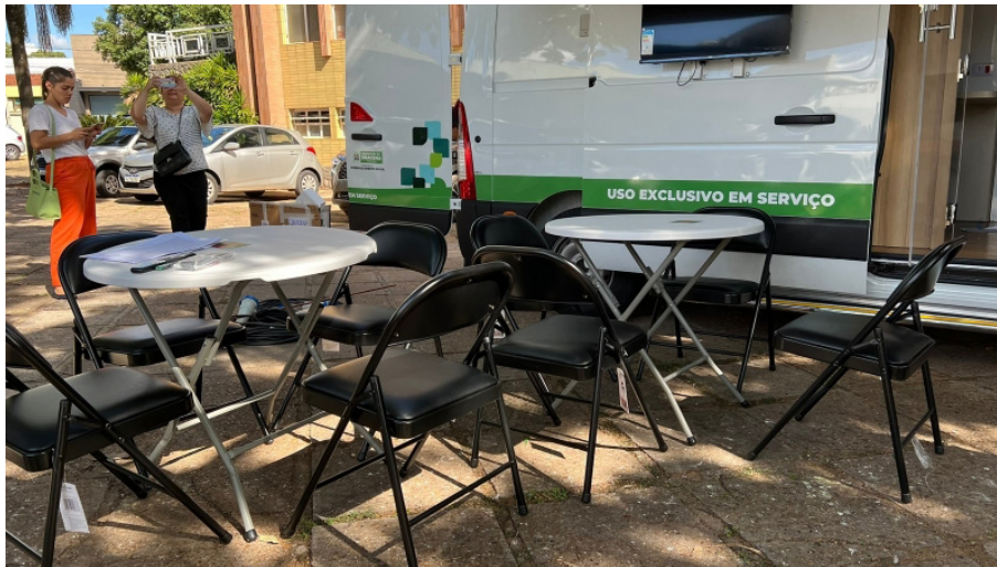
CRAS Volante percorrerá bairros e distritos para atendimentos sociais