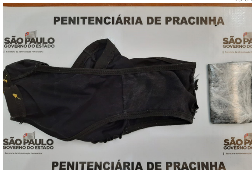
Penitenciária de Pracinha