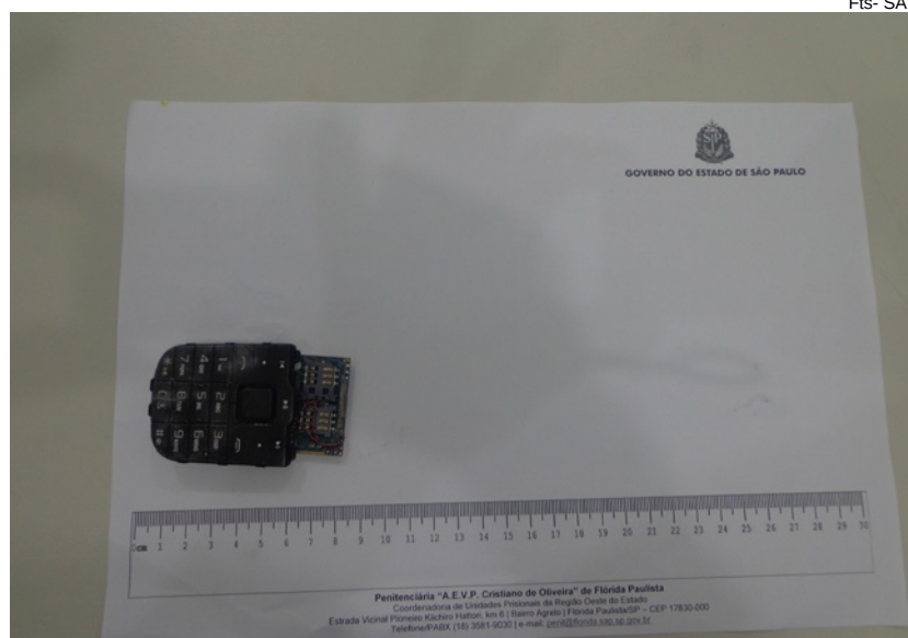
Penitenciária de Flórida Paulista

Em todas as ocorrências, os sentenciados foram encaminhados preventivamente ao Pavilhão Disciplinar, de onde responderão procedimentos disciplinares para apuração de possível cumplicidade.