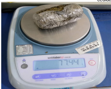
Maconha apreendida na Penitenciária de Junqueirópolis

SECRETARIA DE ADMINISTRAÇÃO PENITENCIÁRIA (SAP)