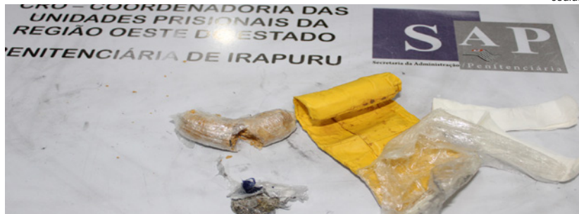
Maconha, cocaína e k-4 também apreendidos na penitenciária de Irapuru

A Secretaria de Administração Penitenciária (SAP), divulgou nesta terça-feira, 10, as apreensões de drogas e aparelho celular durante os dias de visitas, sábado, 7 e domingo em duas penitenciárias da região, Junqueirópolis e Irapuru