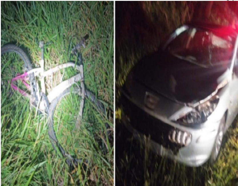
Colisão ocorreu domingo, 8, à noite em Marabá Paulista