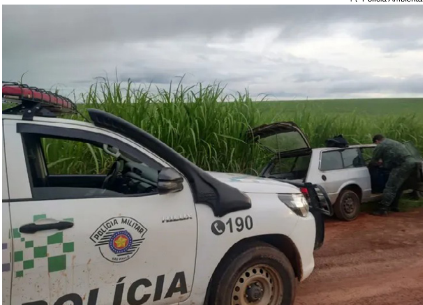
Ft- Polícia Ambiental