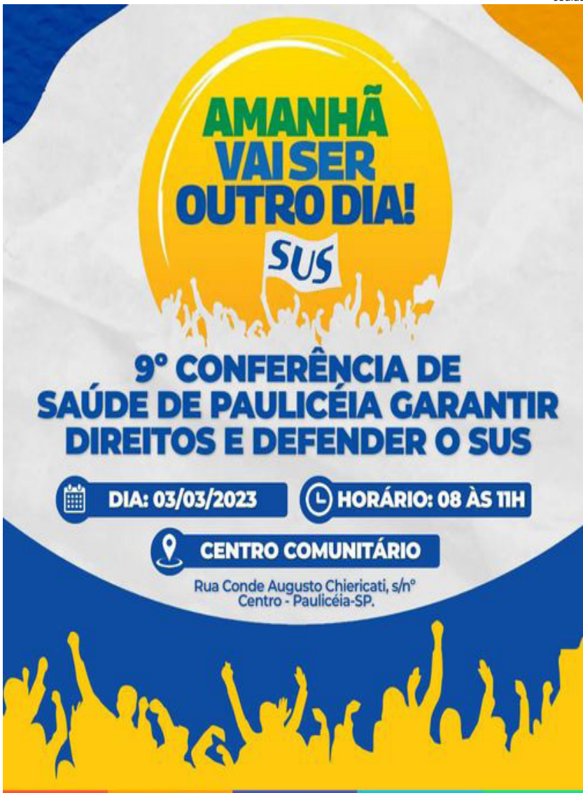
Conferência Municipal de Saúde de Paulicéia