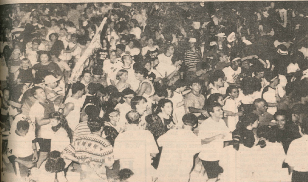
O Carnaval da Geração Cara Pintada Jotou o ginásio de esportes da ABD