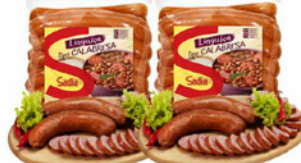
LINGUIÇA CALABRESA SADIA À GRANEL KG.