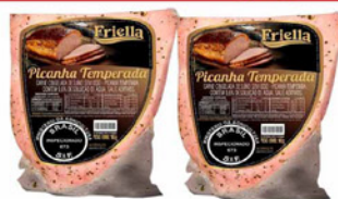
PICANHA SUÍNA TEMPERADA FRIELLA KG