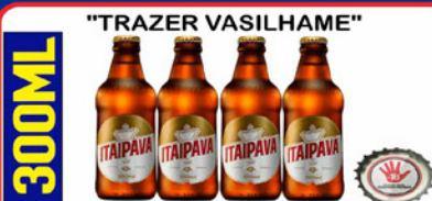
CERVEJA ITAIPAVA PILSEN 300 ML GARRAFA