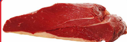
PONTA PEITO SEM OSSO KG