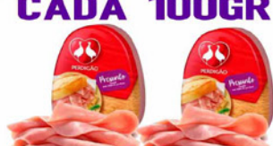
PRESUNTO PERDIGÃO FATIADO A GRANEL CADA 100 GR.