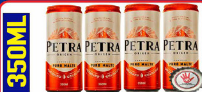
CERVEJA PETRA ORIGEM 350 ML PURO MALTE LATA