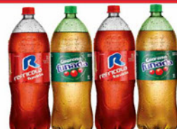
GUARANÁ FUNADA REFRIGOLA 2 LT PET