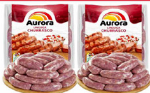
LINGUIÇA TOSCANA AURORA CHURRASCO KG