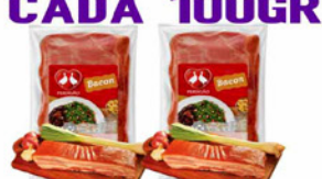
BACON PERDIGÃO PEÇA/ PEDAÇO CADA 100 GR.