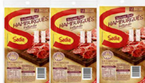
SALAME SADIA 100 GR. HAMBURGUESES EM FATIAS