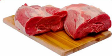
MUSCULO DIANTEIRO KG