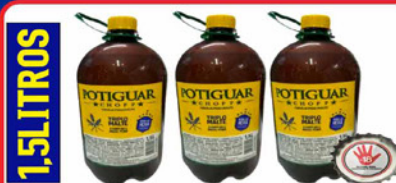
CHOPP POTIGUAR 1,5 LT TRIPLO MALTE PET