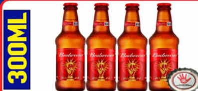
CERVEJA BUDWEISER 330 ML LONGNECK