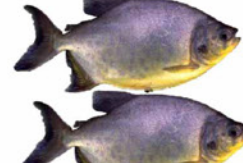
PEIXE PACU INTEIRO KG.