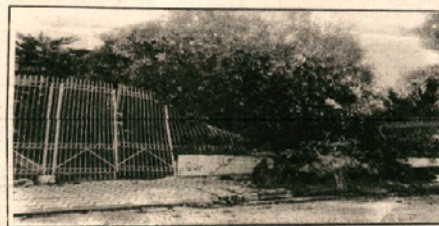
Na rua Euclides da Cunha a árvore caiu e se precipitou sobre a grade de uma residência

Ventos que chegaram a atingir cerca de 100 quilômetros horários, seguidos de rápida chuva de granizo em alguns locais, provocaram enormes danos para esta cidade no domingo à noite. Residências destelhadas, árvores arrancadas, violentos prejuízos para diversas firmas comerciais e danos nas redes elétrica e telefônica foram algumas das ocorrências que se verificaram após os efeitos do vendaval.