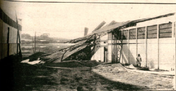
Arrancado pela ventania, o telhado da Retífica Boa Estrela foi ao chão