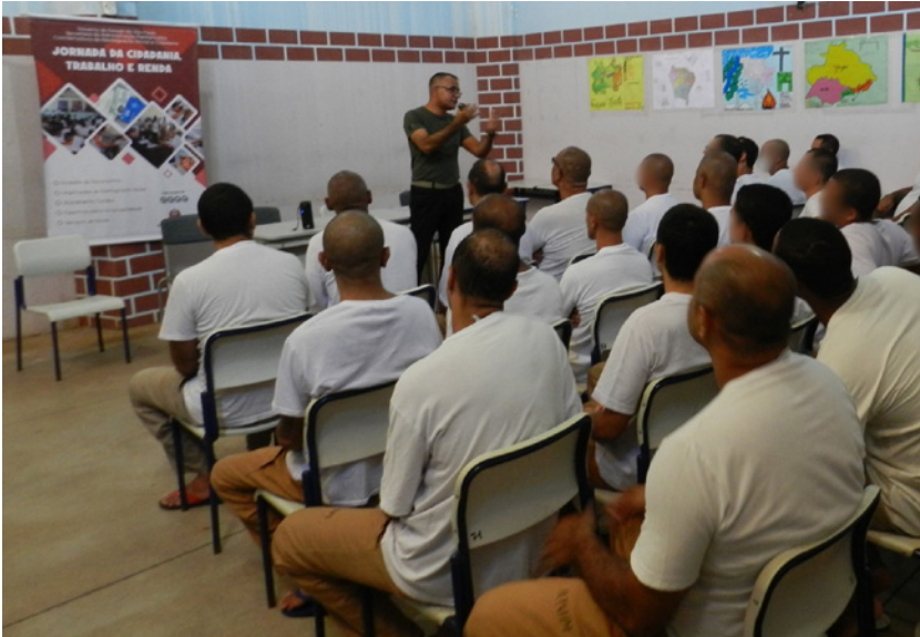
Palestra sobre prevenção às drogas para reeducandos da Penitenciária de Tupi Paulista