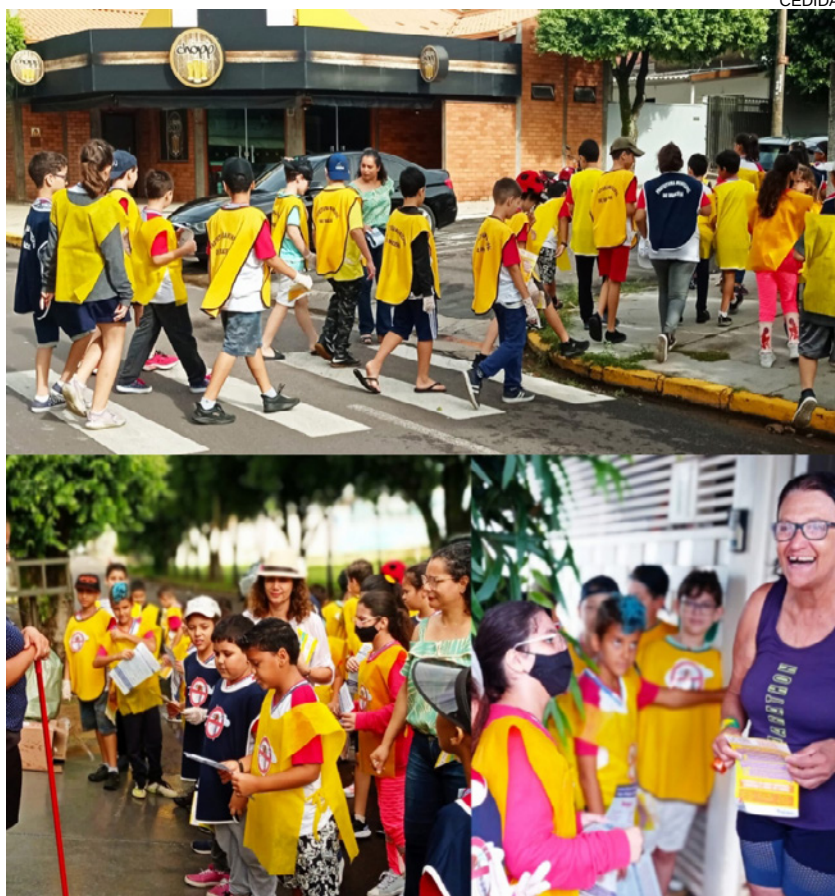
ATurma de alunos e professores durante o trabalho