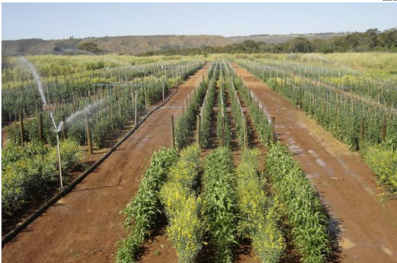
Vista geral do sistema de irrigação em produção de tomate