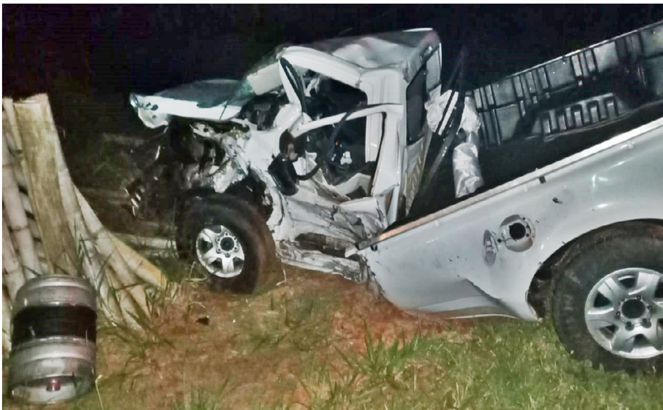
Estado da caminhonete S10 no acidente

Do fato resultaram 4 vítimas leves (25 e 26 anos), entre elas uma criança de 3 anos e 1 bebê de 03 meses, além de 1 grave (30 anos) e 1 fatal (31 anos) que era passageira do Renault/Duster, mãe das crianças e esposa da vítima grave