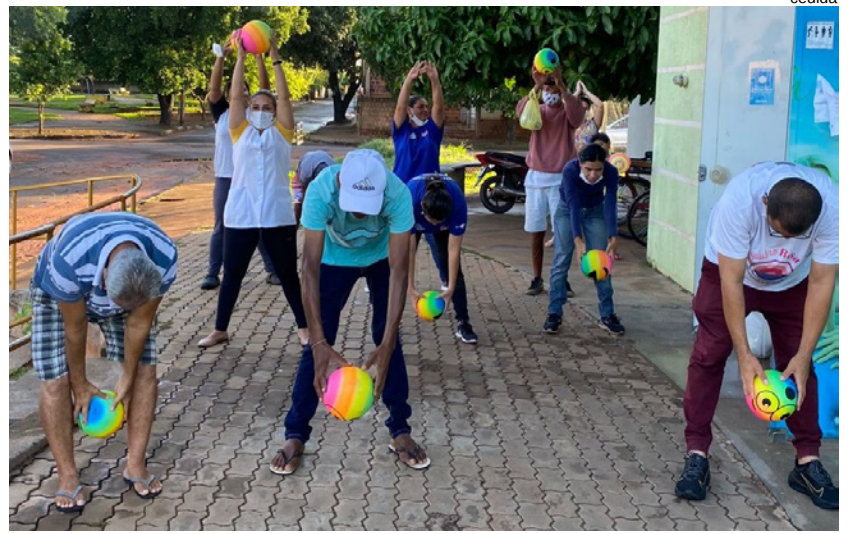
Projeto oferece fisioterapia aos frequentadores das ESFs dos bairros