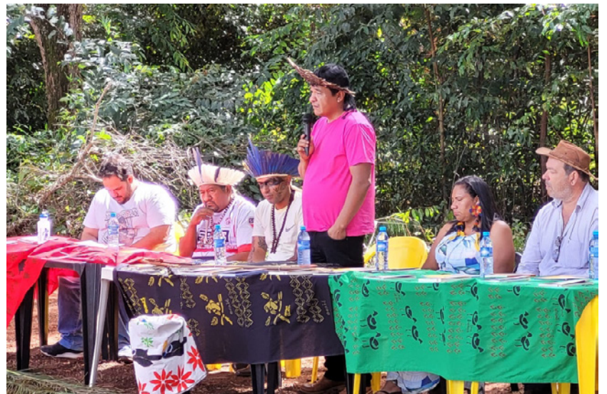
Atividades da rede municipal de Educação em comemoração ao Dia do Índio