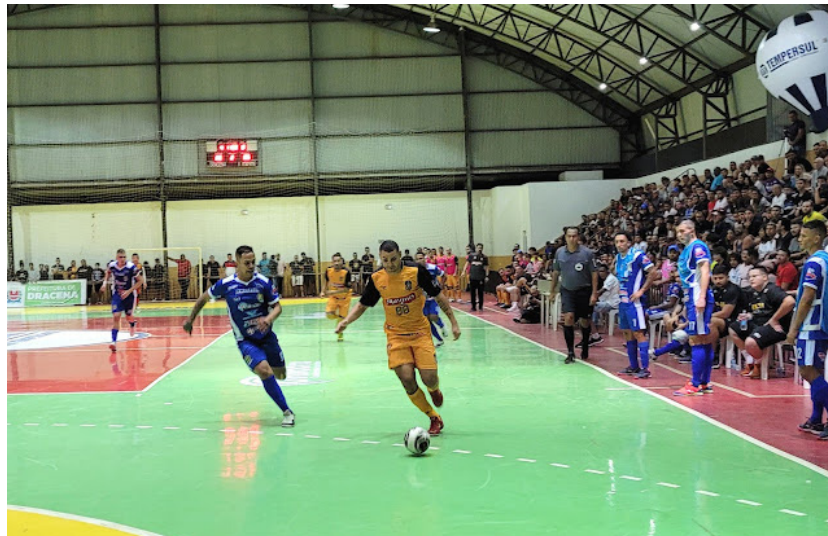
Time sorocabano lidera o grupo A do Campeonato Paulista de Futsal