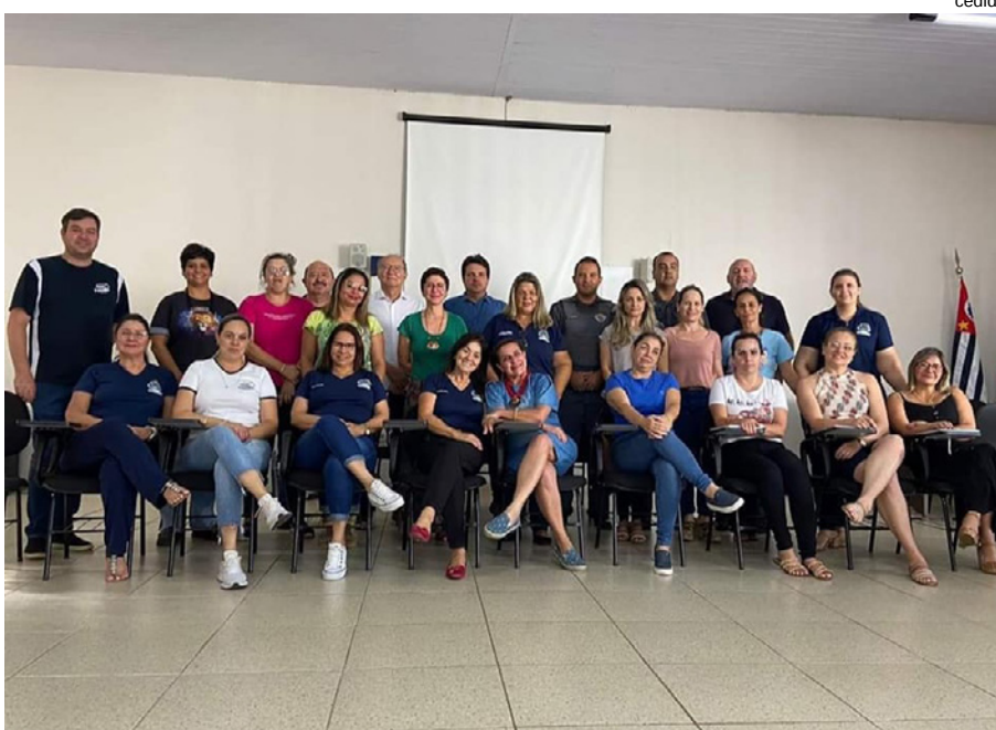
Reuniões com prefeitos e gestores das redes estadual e municipal de Ensino nas cidades da 4ª Cia PM de Tupi Paulista

APLICATIVO - A Polícia Militar também está orientando os alunos sobre a utilização do aplicativo 190 SP da Polícia Militar, na opção “Segurança Escolar”, que prioriza as ocorrências em escolas proporcionando ainda mais agilidade no atendimento policial, bem como orientação aos pais e responsáveis para que se atentem aos seus filhos, como conteúdo de Internet que utilizam, mudança de comportamento e verificação das mochilas.