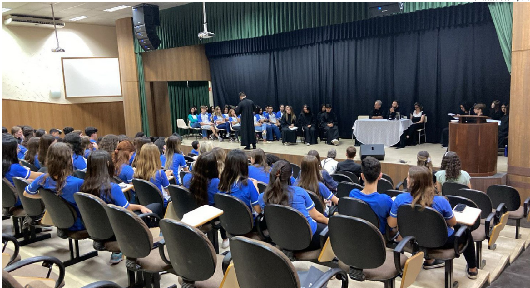
Alunos do Ensino Médio do Anglo-Cid durante o simulado de julgamento baseado na obra literária Dom Casmurro