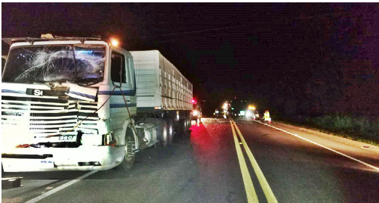
Frente da carreta após a colisão da caminhonete

(condutor). O condutor da carreta (38 anos), não teve ferimentos.