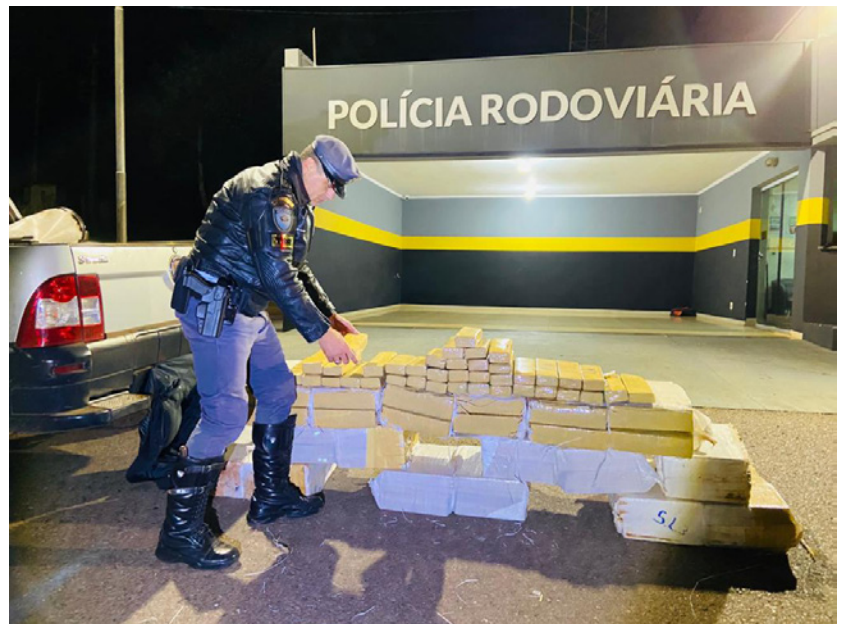
Dois homens foram presos em flagrante