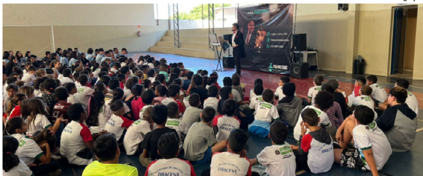
Mágico Mauro Dias abordou assunto de maneira cuidadosa e apresentou as diversas formas de abuso