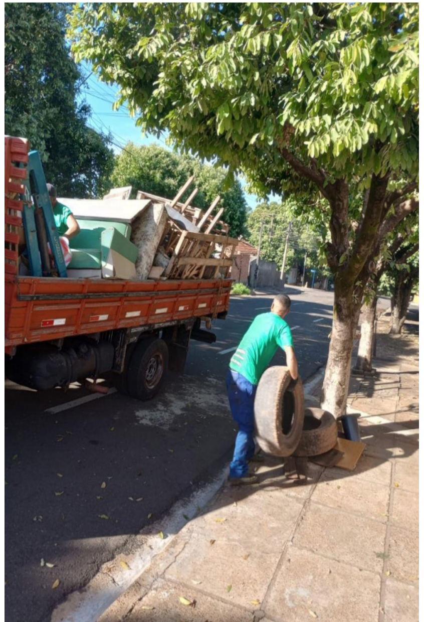
Grande quantidade de objetos com riscos de acumular água foram descartados

Foram descartados pela população grande quantidade de objetos que não