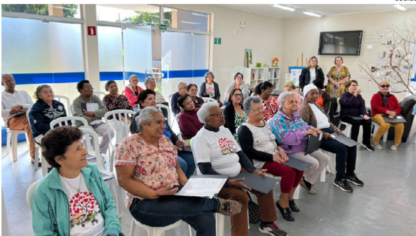
Idosos participaram do projeto "Eu e minha família, lugar de carinho"