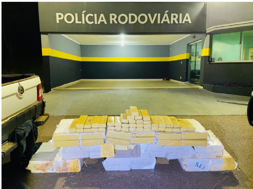
Droga estava em uma picape Fiat Strada, de Quatá, SP