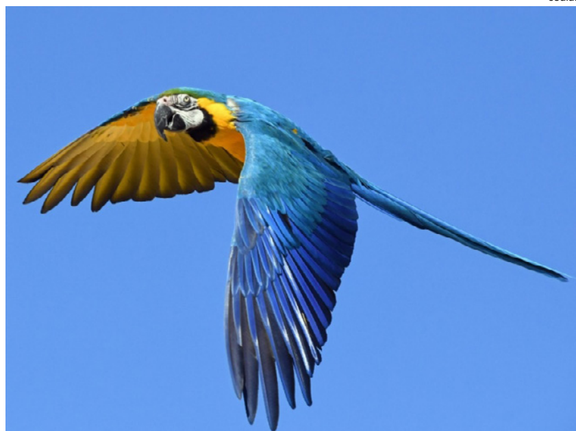
Arara Canindé, sempre presente nos céus de Dracena