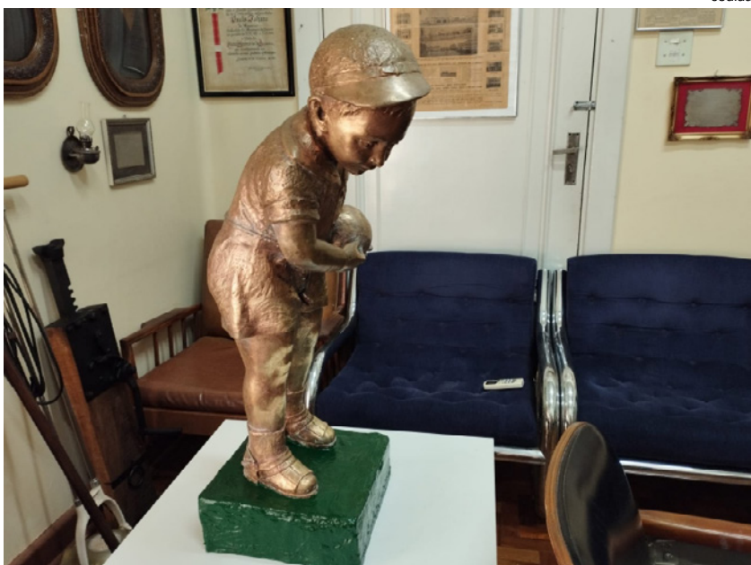
Menino Arthurzinho, atração na cidade desde 1957