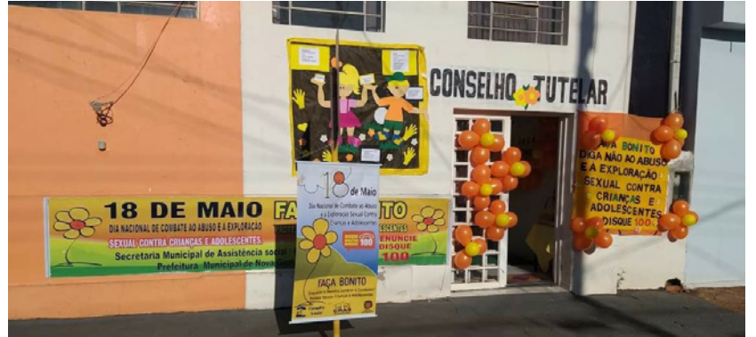
Ações do Dia Nacional de Combate ao Abuso Sexual de Crianças e Adolescentes, em Nova Guataporanga