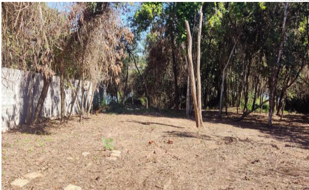
Homem foi multado por destruir área de preservação ambiental no Balneário Municipal de Rancharia