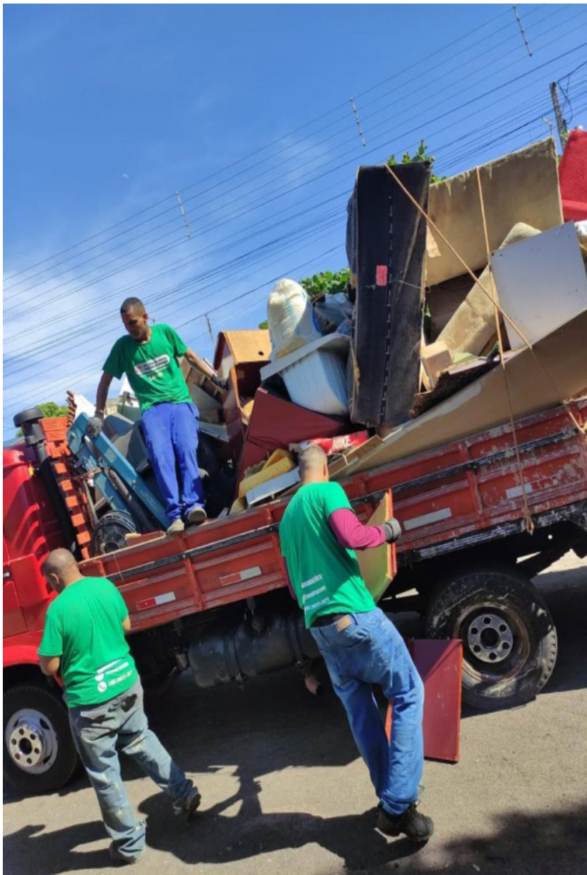
Mutirão de limpeza foi realizado de 8 a 16 deste mês