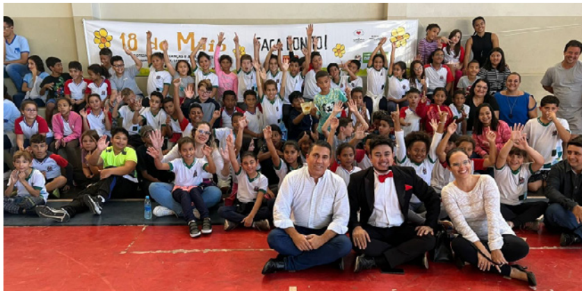
Ação faz parte da campanha de combate ao abuso e exploração sexual contra crianças e adolescentes