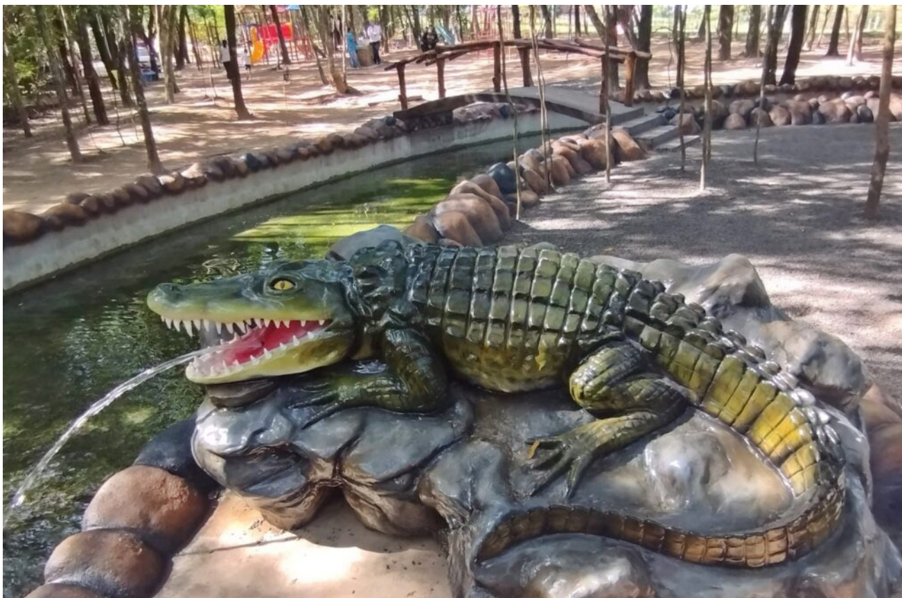
Animais em fibras associados à fauna brasileira

ASSESSORIA DE IMPRENSA PREF. DE JUNQUEIRÓPOLIS