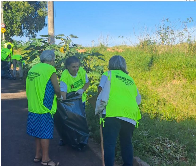
Ecocaminhada retirou lixo do Bosque do Jardim Brasilândia, objetivo é conscientizar contra o Aedes