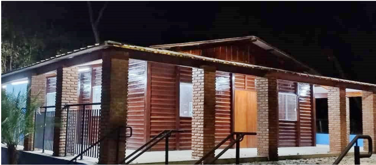
Centro de Educação Ambiental