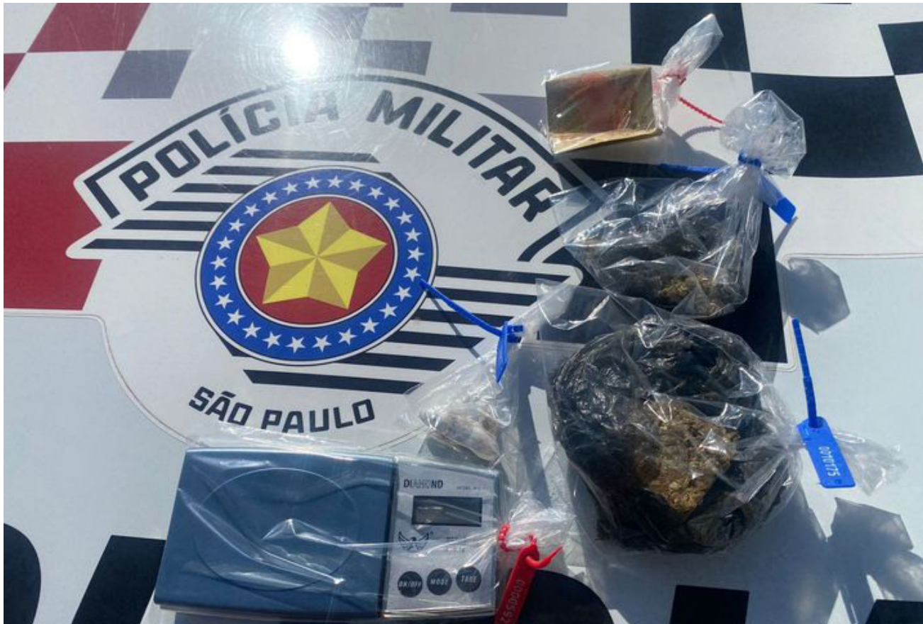
Droga apreendida durante atendimento de ocorrência de briga de casal