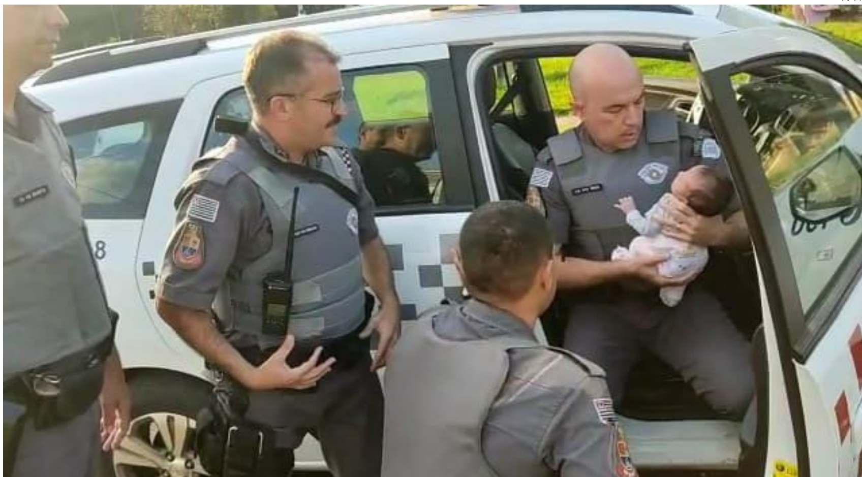
Polícia Militar realizou manobra de "Heimlich, salvando o bebê