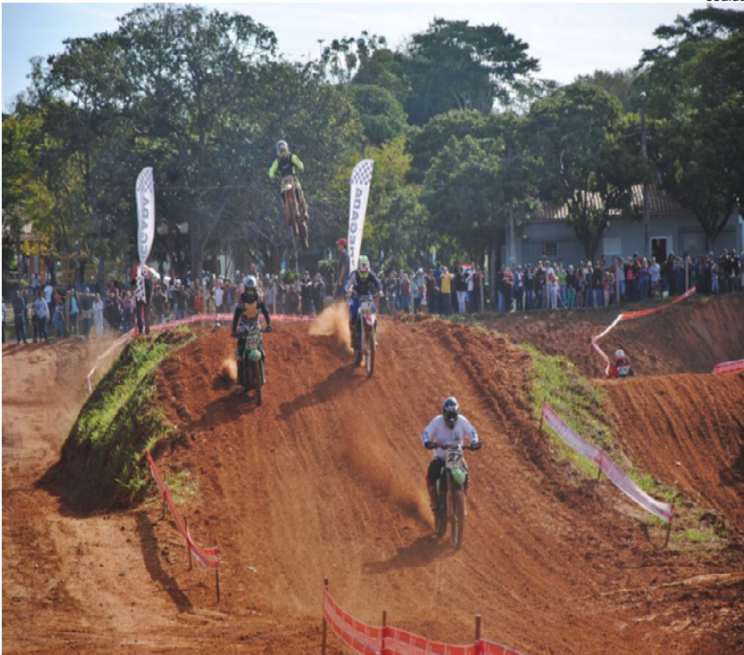
Campeonato de Motocross inicia às 9h deste domingo na pista de provas