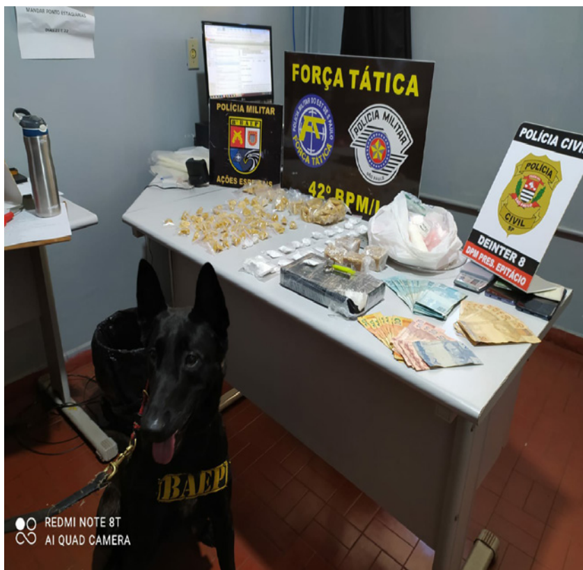
Apreensões na operação conjunta da Polícia Militar e Civil, hoje, 2, em Presidente Epitácio