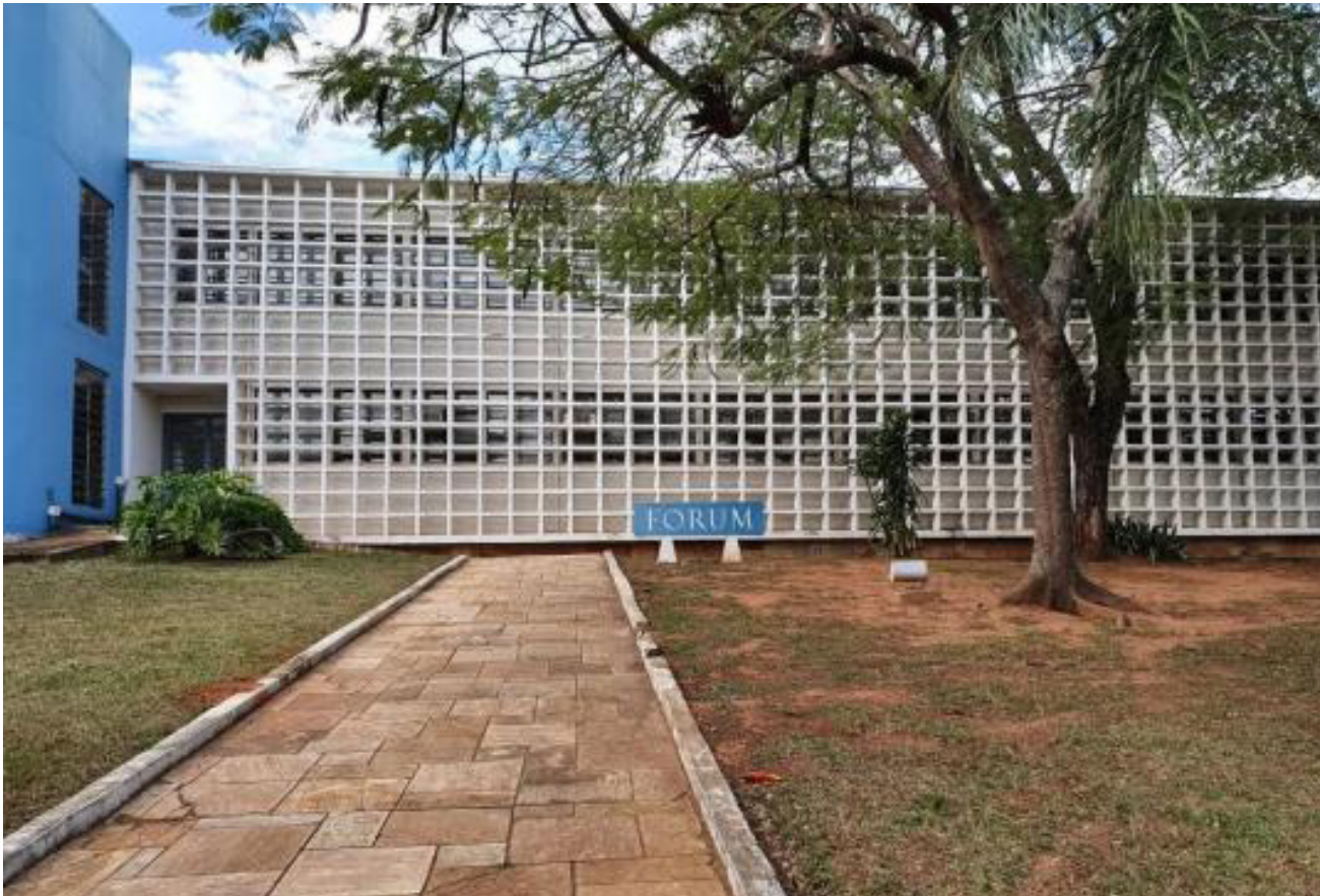
Fórum de Presidente Prudente

Vítimas eram rendidas após serem contratadas para serviços de carroto