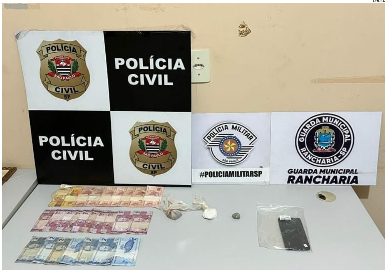
Droga, dinheiro e celular apreendidos e duas prisões efetuadas na operação na vila Sossego, em Rancharia