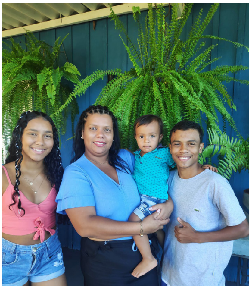
“Eu e meus tesouros que jeova me deu, amo meus filhos”