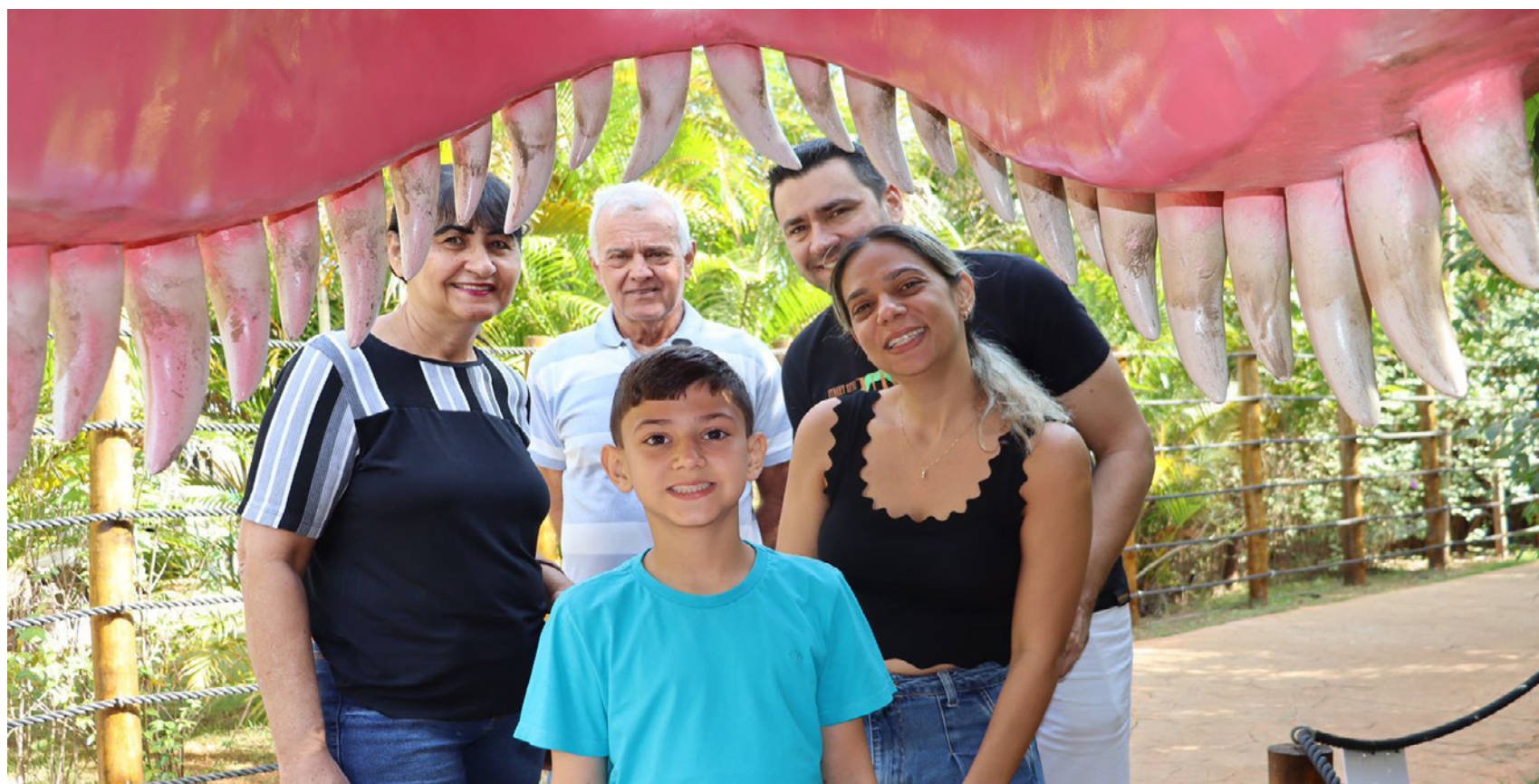
Passeio em Parque dos dinossauros em Olímpia