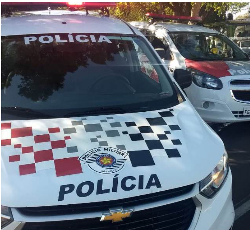
Acusado foi encontrado pela PM com uma faca e galão de combustível