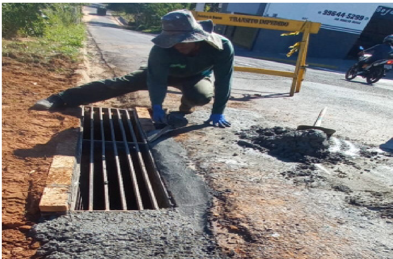
Intervenção na galeria pluvial na Rua Berlamino Neri