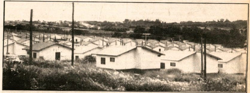
Uma visão do núcleo construído pela Faganello (foto-arquivo)

Entre Imposto Sobre Serviço de Qualquer Natureza e Imposto Territorial Urbano, a Construtora Osvaldo Faganello - Engenharia e Construção Ltda. deve Cr$ 1.449.733,925,03 à prefeitura de Dracena.