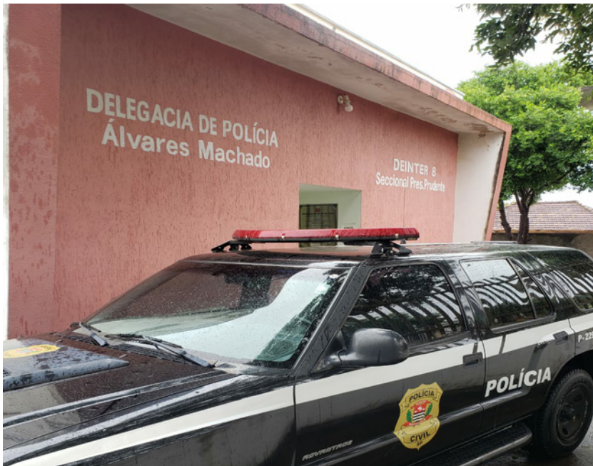
Delegacia de Polícia de Álvares Machado identificou autor do crime