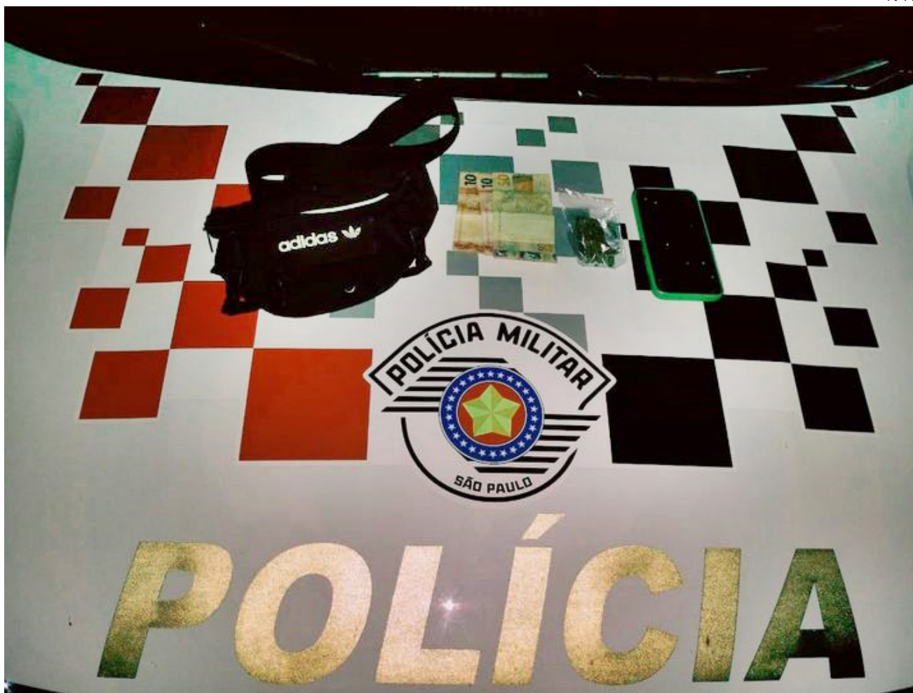
Pochete, droga, aparelho celular e dinheiro apreendidos