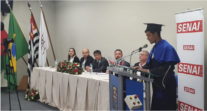
Formatura do curso Mecânico de Usinagem Convencional