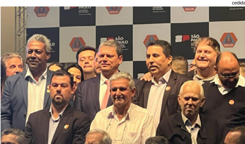
Prefeito André Lemos ao lado do governador Tarcísio de Freitas durante o evento

Dracena foi uma das cidades beneficiadas, assinando um convênio de R$ 530.096,29, para recuperação da estrada Marcelo Lorensetti