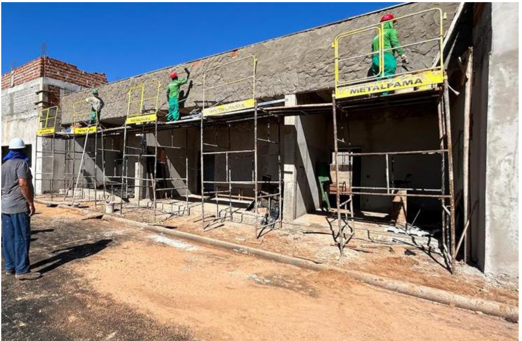
Construção da Rede Lucy Montoro em Prudente, que irá atender pacientes da região