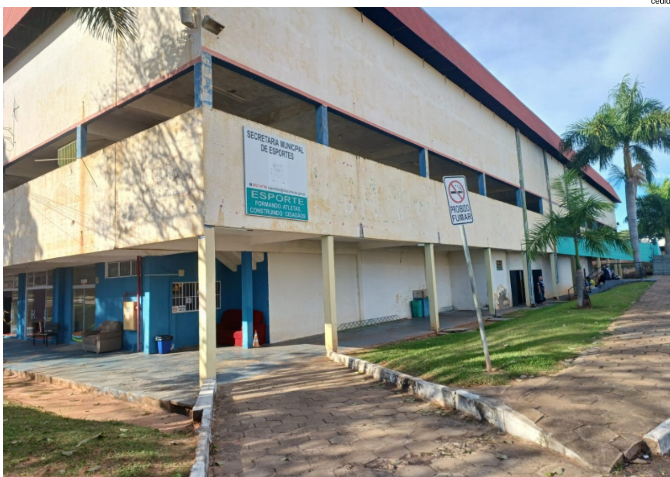
Equipe dracense joga às 14h contra Dragons de Tupã