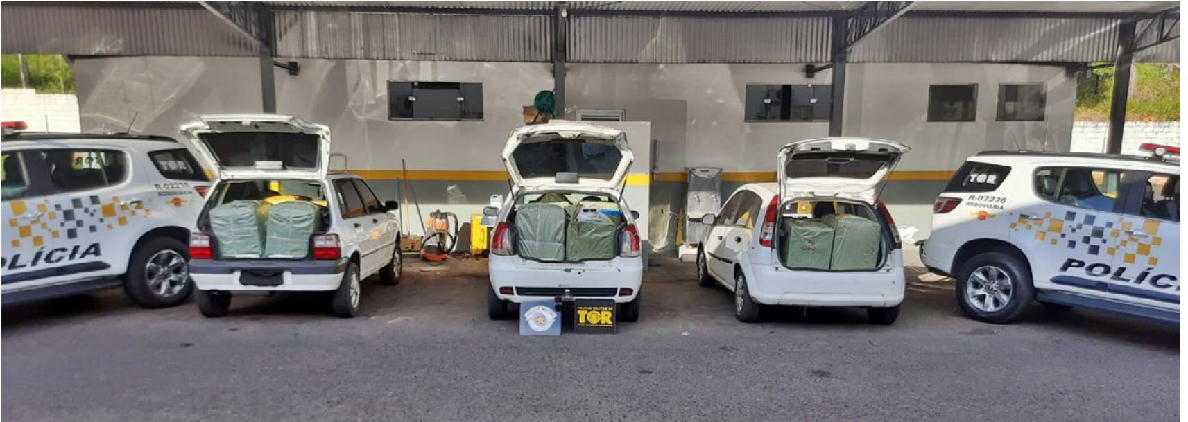
Peças de óculos e cigarros eletrônicos sem documentos fiscais apreendidos