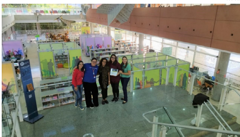
Biblioteca de São Paulo (BSP)