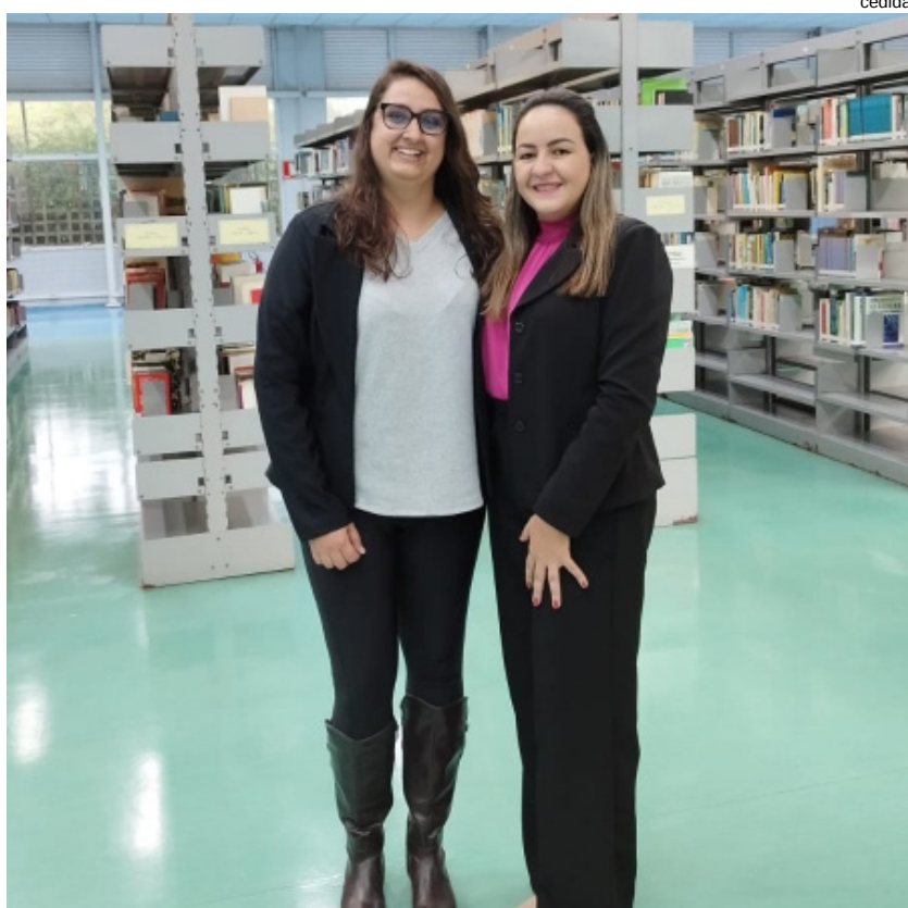
Biblioteca EACH (USP)