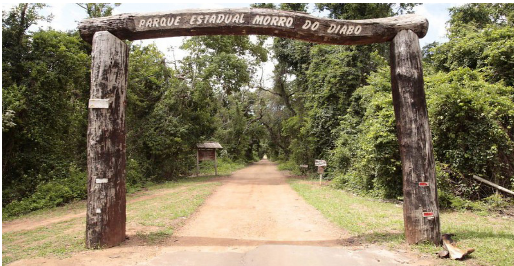
Portal do Parque Estadual do Morro do Diabo, em Teodoro Sampaio