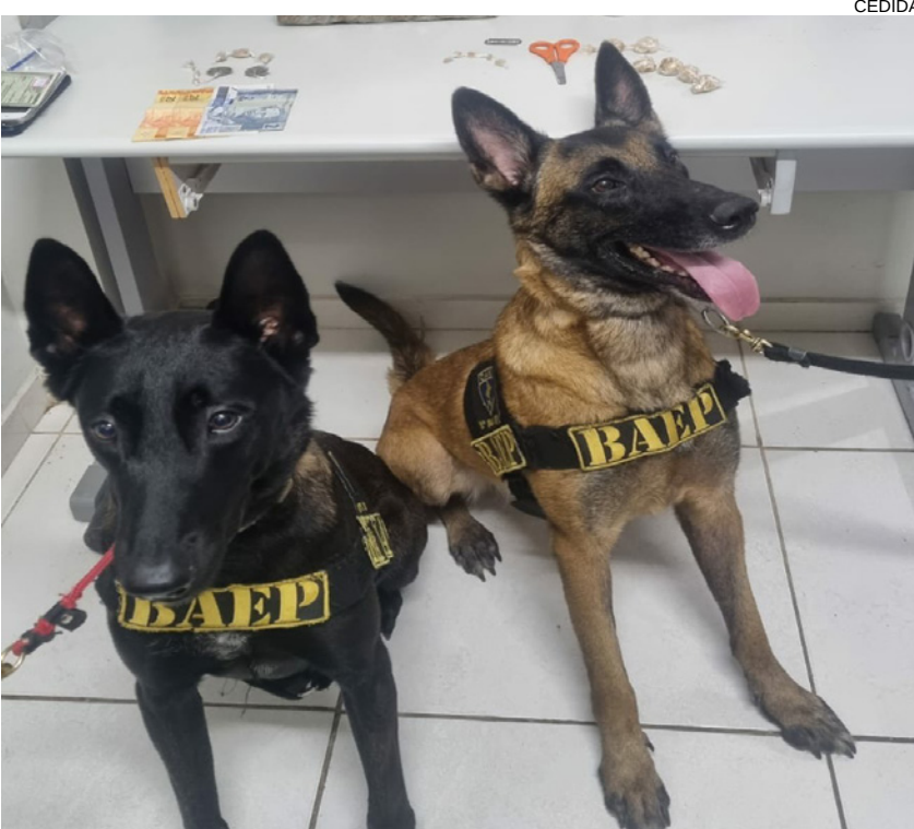
Canil da Polícia Militar participou da operação