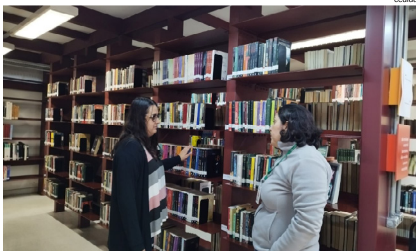
Biblioteca Mário de Andrade (BMA)