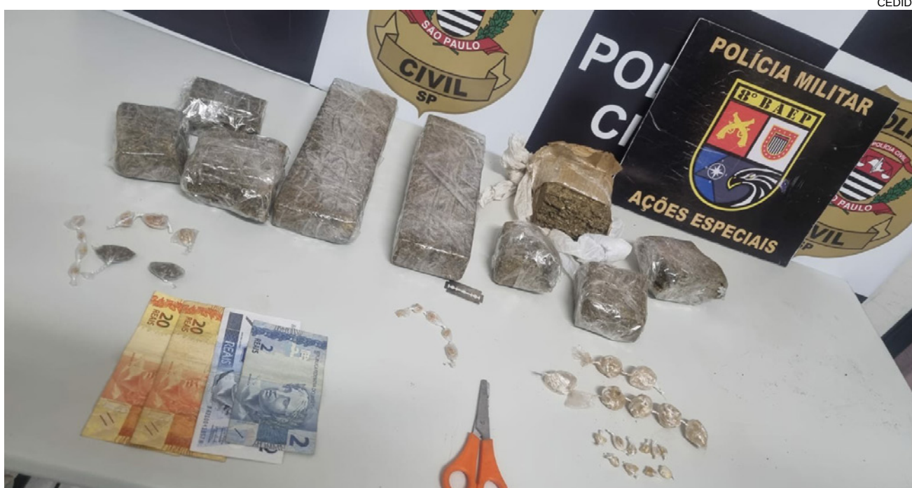
Drogas apreendidas na operação em bairros de Presidente Prudente