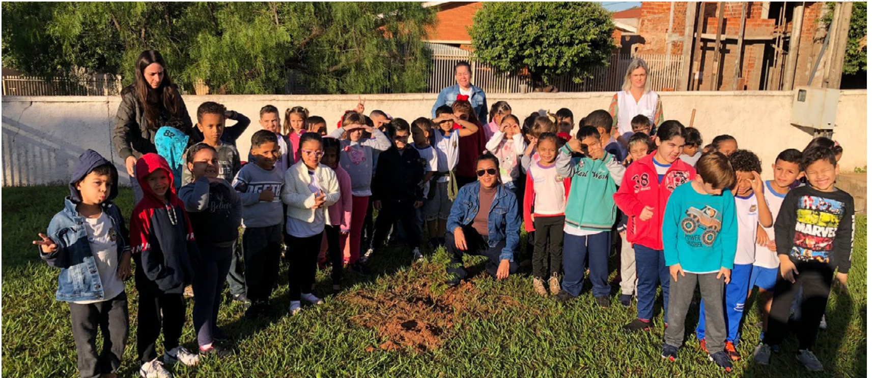
Alunos das escolas municipais com a coordenadora do Meio Ambiente, fazem plantio de árvore