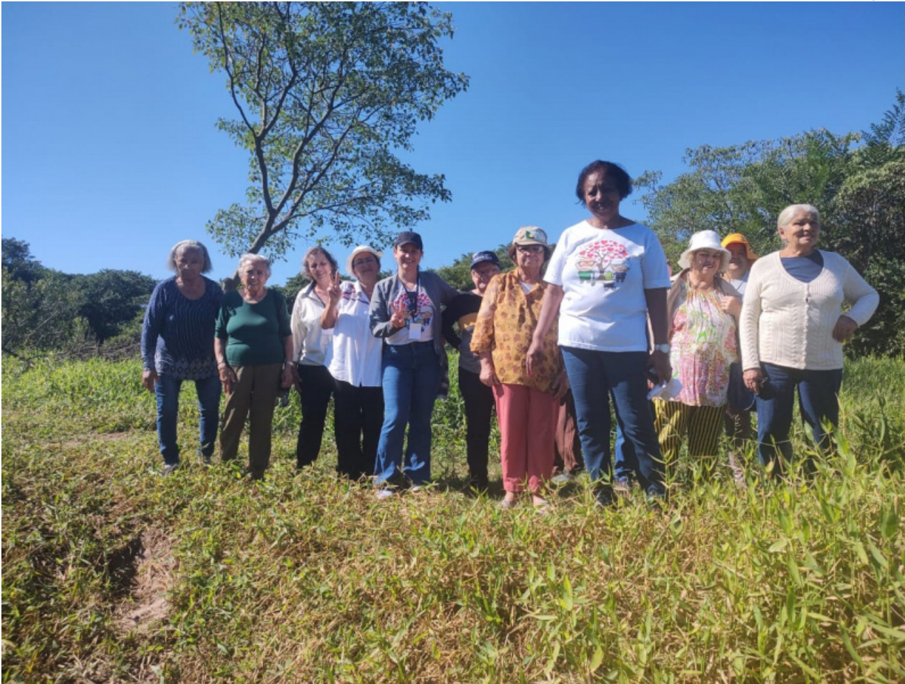
Integrantes do CCI em visita ao Parque Estadual do Aguapeí, nesta segunda-feira