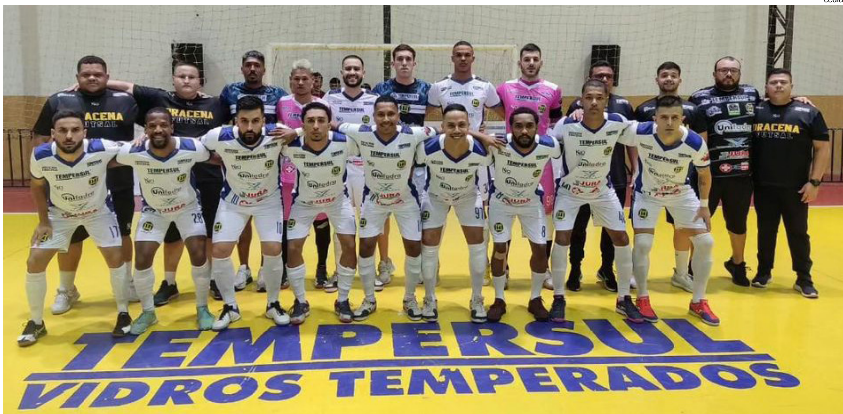
Equipe dracense de Futsal volta a jogar pela Copa Band, nesta sexta em Dracena