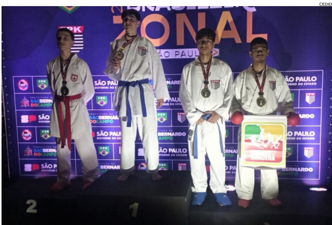
Atletas de Dracena conquistam vagas para o Brasileiro que ocorrerá em novembro