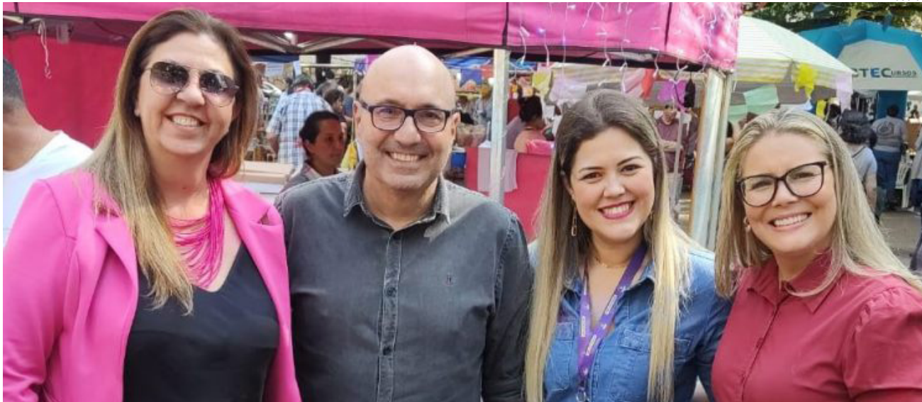
Secretária (à esq.) ao lado do prefeito de Campinas : trocas de conhecimentos na Feira das Mulheres Empreendedoras