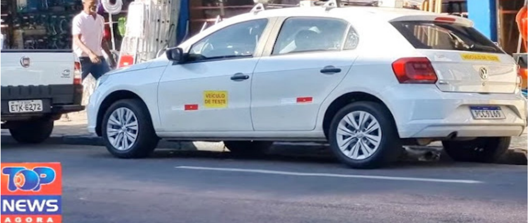
Veículo usado nos testes para a zona azul no trânsito de Dracena