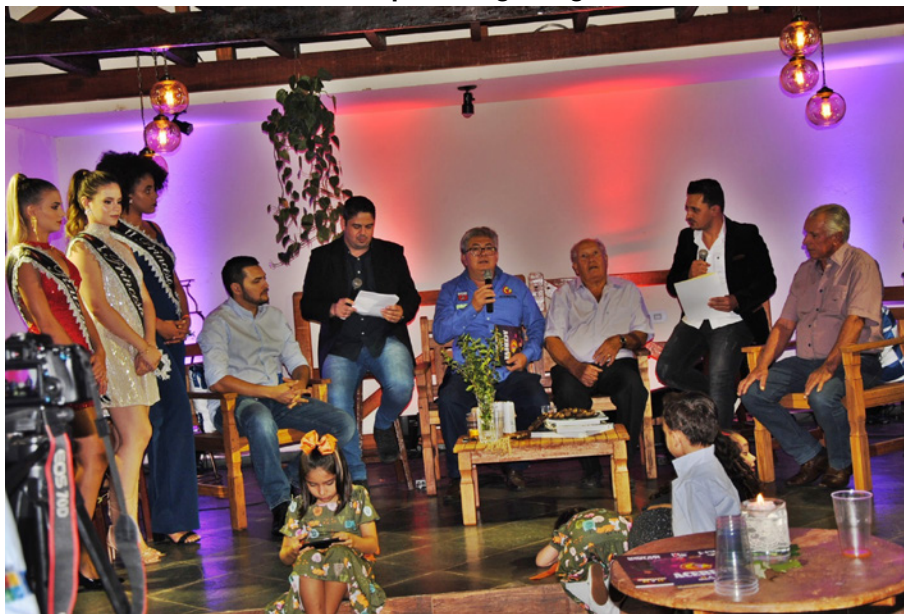
Representantes da Associação Agrícola e Diretoria de Agronegócios