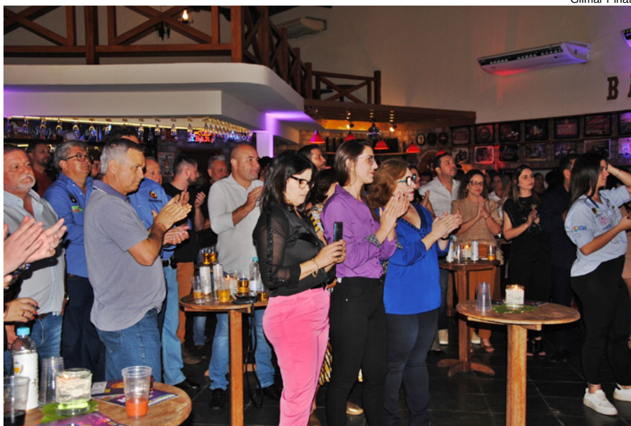
Público presente no lançamento da Aceruva 2023

agro, temos a cana-de-açúcar e também a produção do leite, a pecuária, a fruticultura, agricultura e horticultura diversificadas e a Aceruva é uma festa reconhecida que se torna uma vitrine para que nossos produtores alcancem cada vez mais mercados”, pontuou.