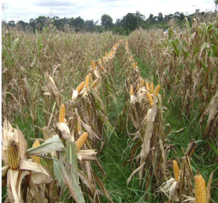
Milho consorciado com a braquiária é exemplo de intensificação do sistema de produção

Através das pesquisas já realizadas pela Embrapa, por instituições de ensino e outras instituições de pesquisa, não resta mais dúvida que a diversificação é melhor que a especialização dos sistemas de produção agropecuários. Isso é verdade, tanto sob o ponto de vista econômico, quanto ambiental. Durante muito anos, era frequente numa mesma propriedade o cultivo de uma única espécie, na maioria das vezes sem rotação de culturas. Esse modelo, com o tempo, mostrou-se não ser o mais adequado, principalmente por proporcionar rentabilidade abaixo daquela considerada como mínima, em função das baixas produtividades e do constante aumento do custo de produção.