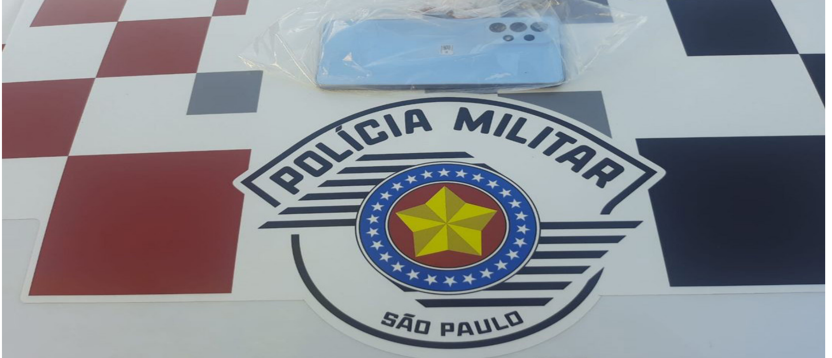
Cigarro de maconha e o celular foram apreendidos