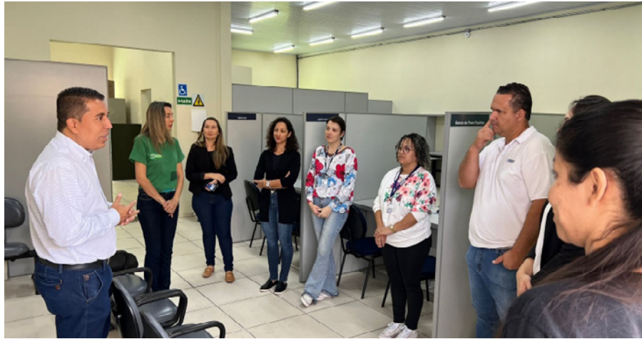
Inauguração realizada na manhã dessa segunda-feira

“O CEDRAC acabou de ser desativado. O local foi uma boa ideia, mas que, por diversos motivos, acabou não dando certo. É um prédio muito grande, inadequado e com custo muito alto para o município. Agora nós trazemos os atendimentos para um local mais adequado, em frente à Prefeitura, com ambiente de atendimento mais bem planejado que