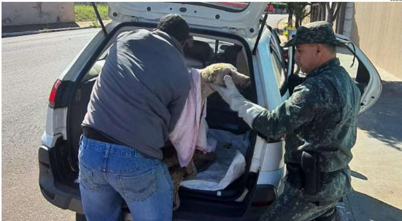
Mulher terá que pagar multa e custear o tratamento do animal