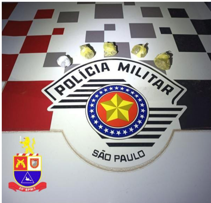
Porções de maconha localizadas pela PM no quarto do acusado

Durante patrulhamento no município de Osvaldo Cruz, sexta-feira, 14, equipe da Polícia Militar visualizou na avenida José Siqueira dois indivíduos, um deles entregando algo para o outro, quando ambos visualizaram a guarnição, empreenderam fuga com destinos opostos.