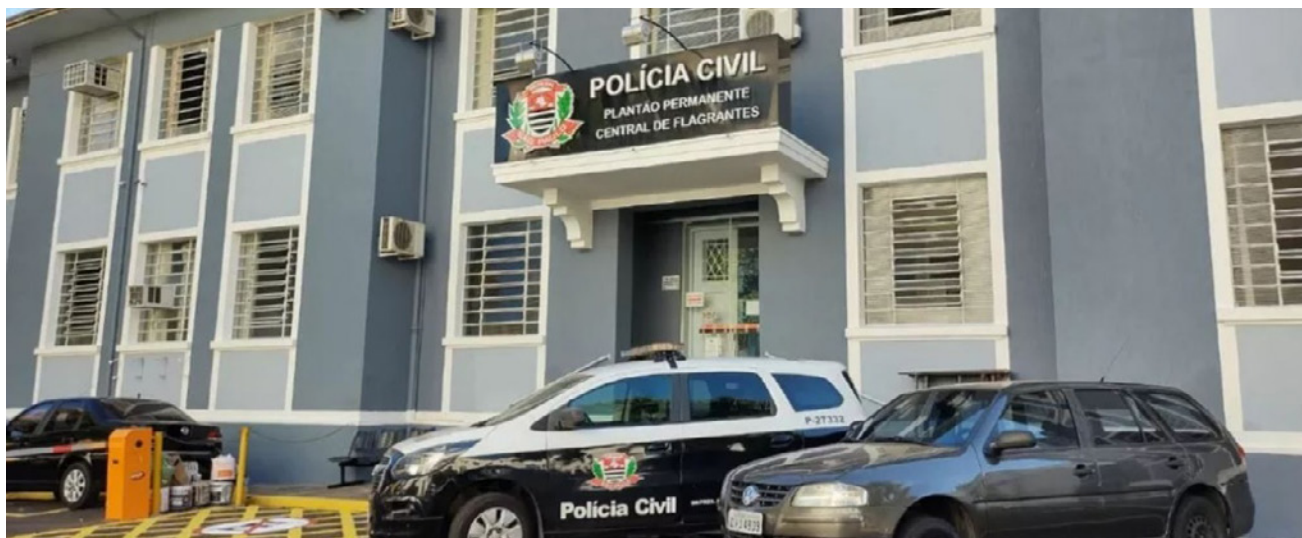
Acusado do crime é preso pela Polícia Civil de Rancharia