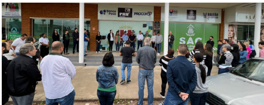
SAC está localizado na av. José Bonifácio, 1430, em frente ao Paço Municipal