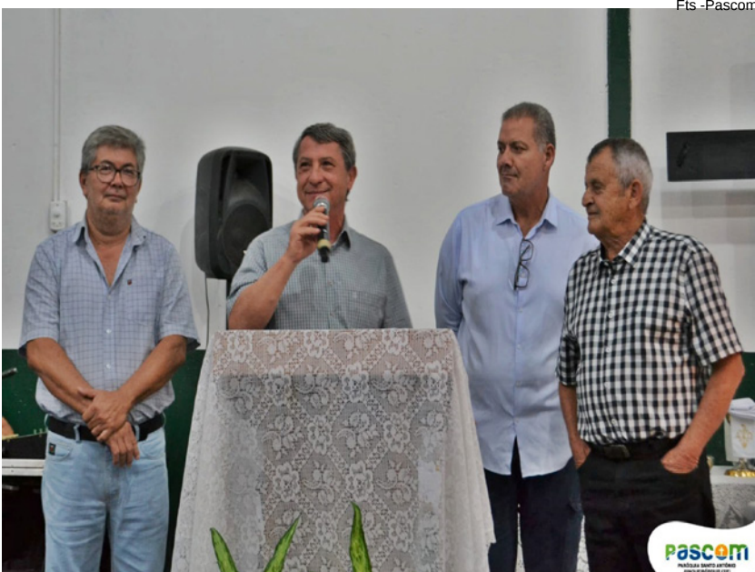
Prefeito Osmar Pinatto fala da importância do agronegócio para o município