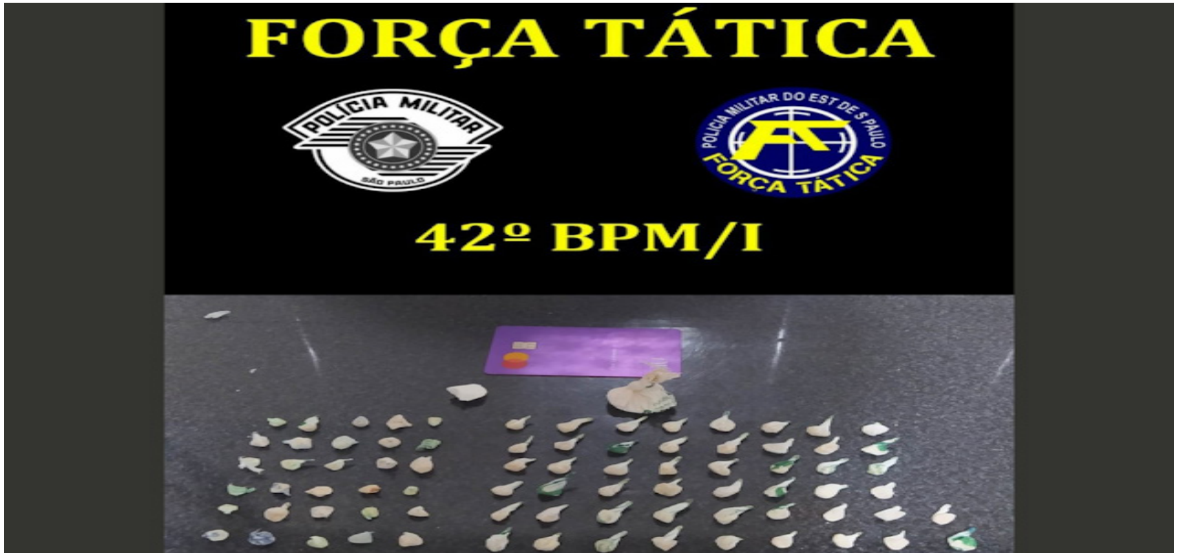
Foram apreendidas 80 porções de crack e duas de cocaína