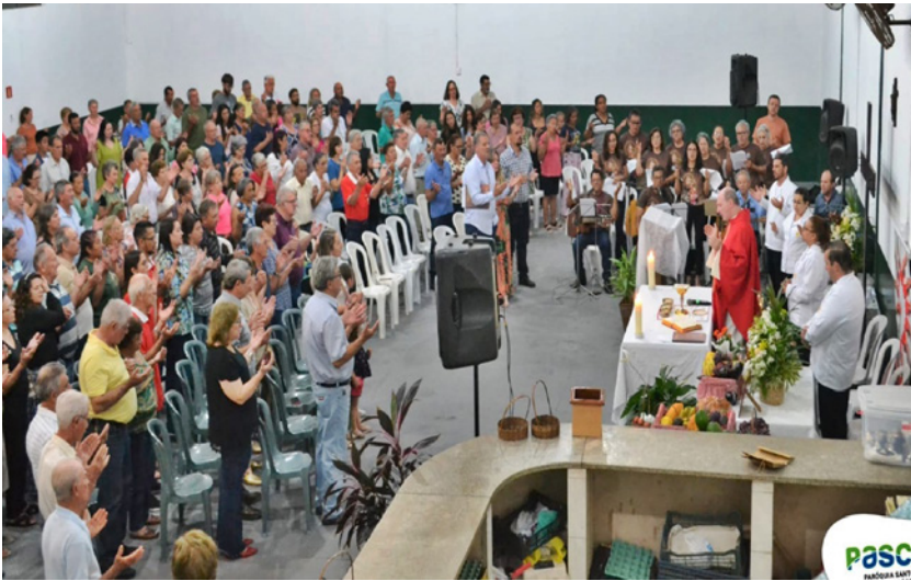
Missa celebrada na sede da Associação Agrícola de Junqueirópolis