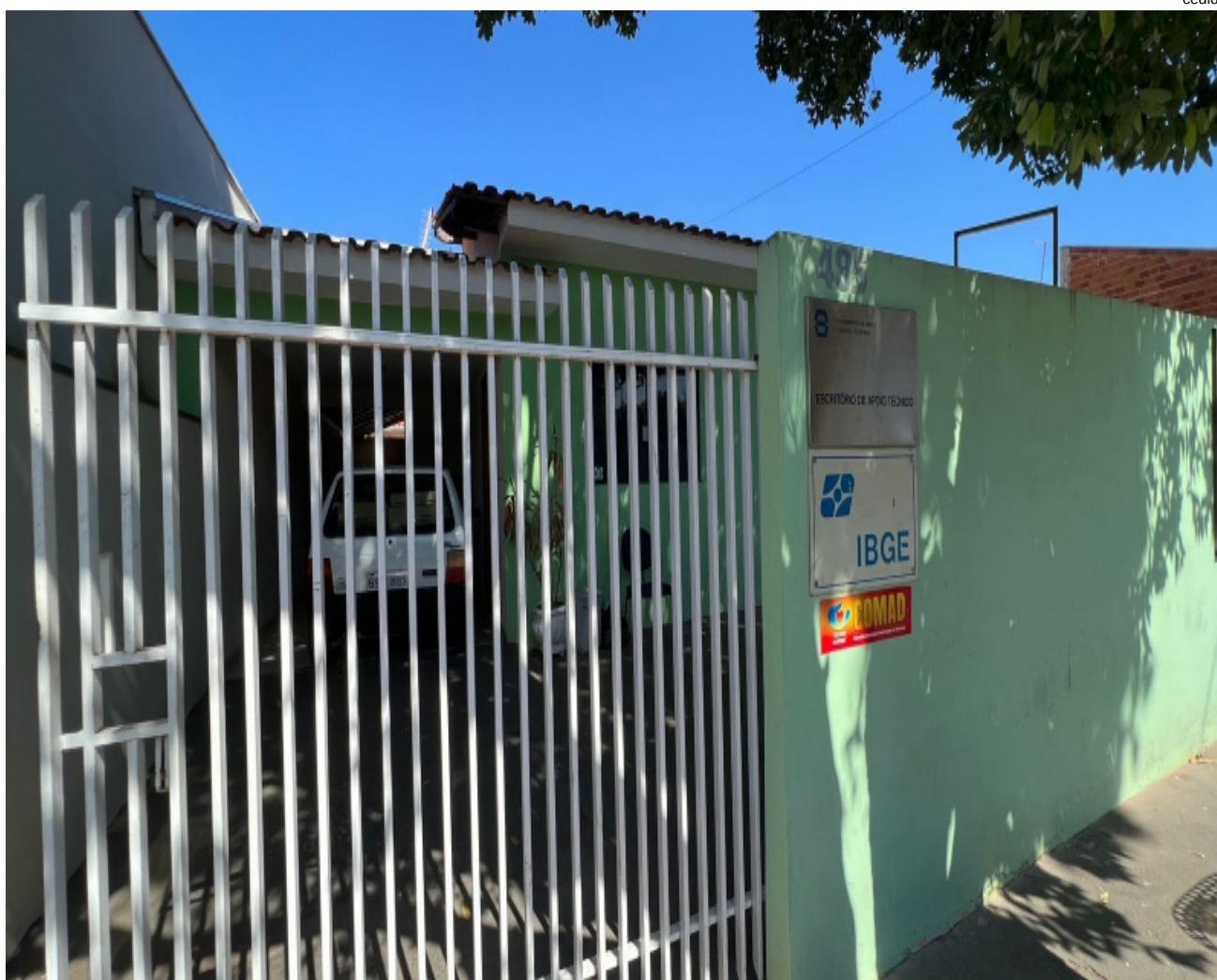
Antigo prédio do CRAS recebeu IBGE, DAEE e Comad