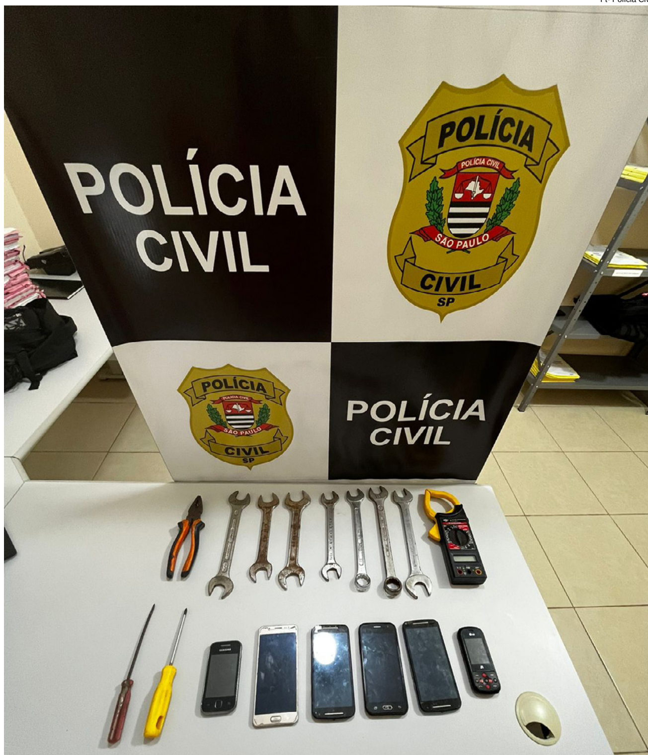
Objetos utilizados no furto dos cabos de transmissão de energia foram apreendidos