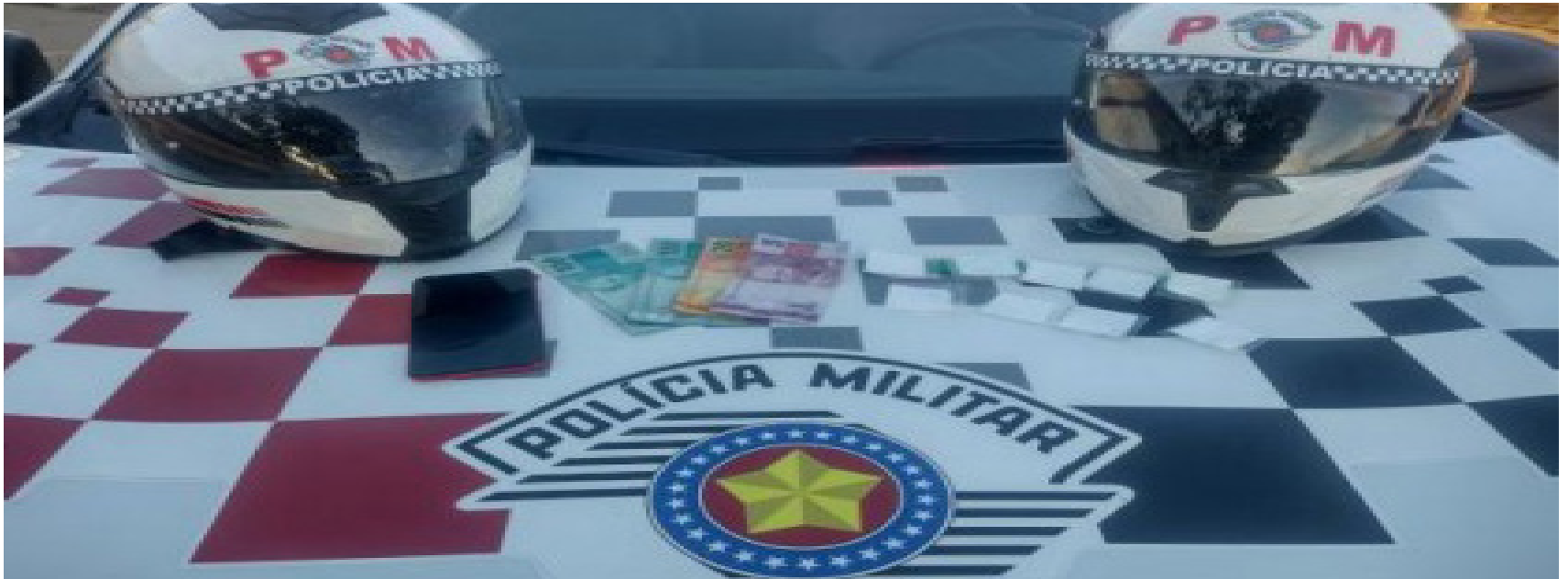
Droga e dinheiro apreendidos durante fiscalização de motos em Osvaldo Cruz