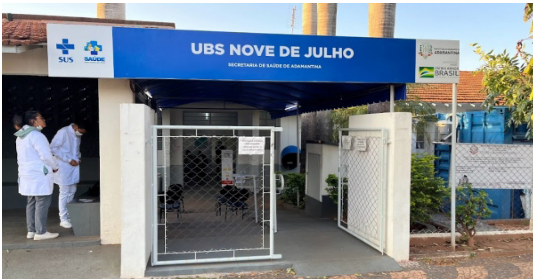
Vacinação contra gripe ocorre nas unidades básicas de saúde do município