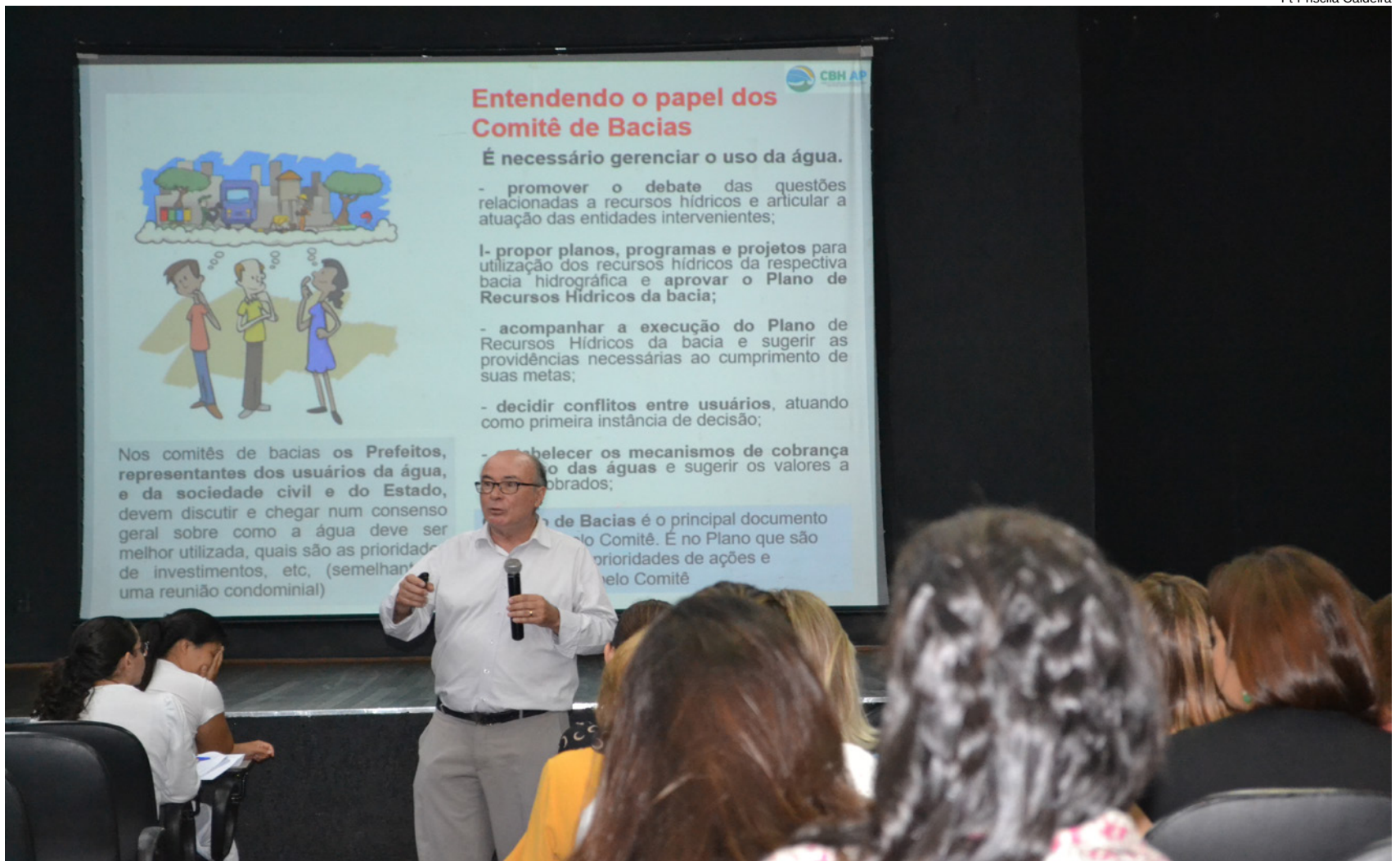
Programa aborda a "Qualidade Ambiental das Bacias dos Rios Aguapei/Feio e Peixe"