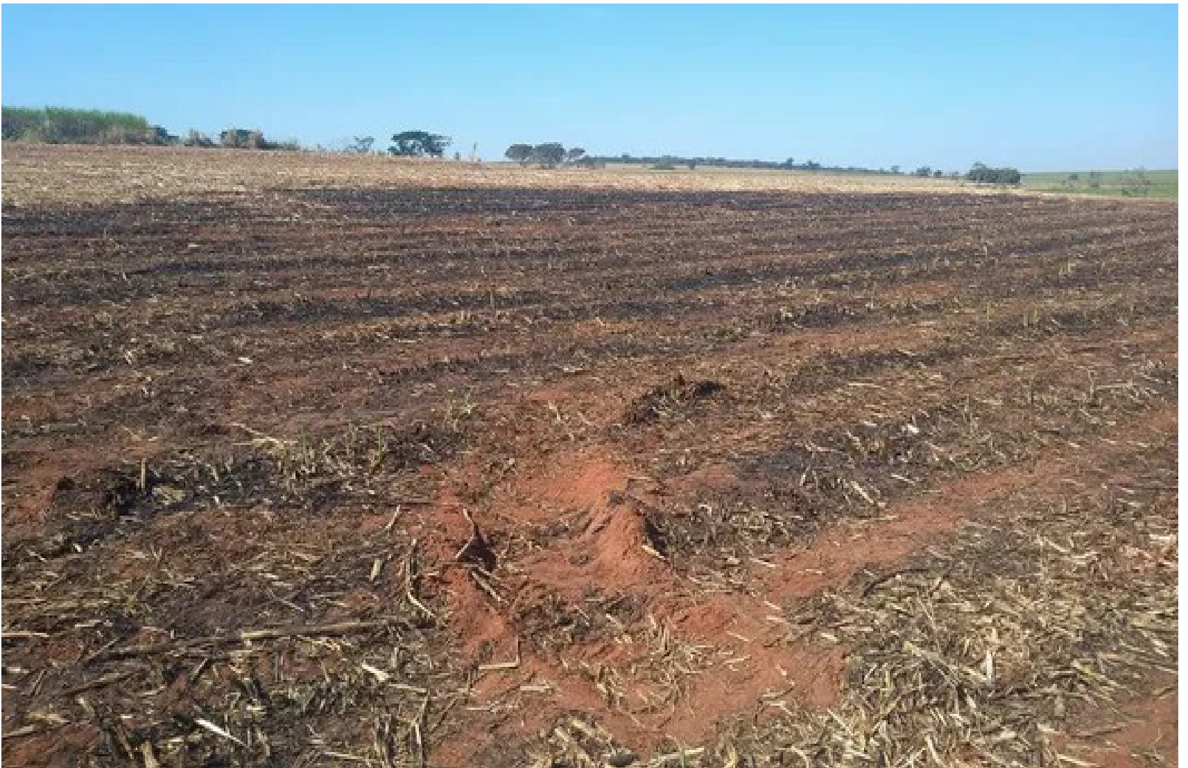
Chamas da colheitadeira se alastraram pela área de proteção permanente (APP)