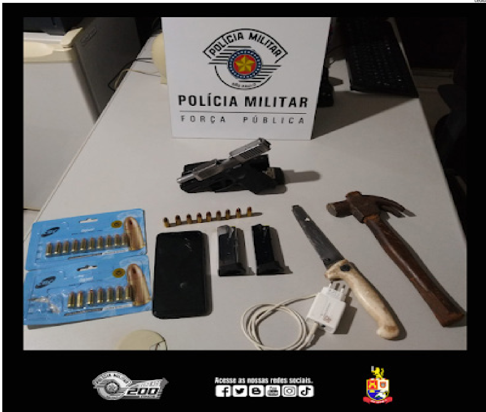
Pistola 9 mm, munição, carregadores e uma faca localizados em Teodoro Sampaio