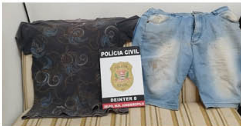
Roupas usadas pelo acusado apreendidas

Homem foi indiciado pelos crimes de estupro de vulnerável, cárcere privado e lesões corporais