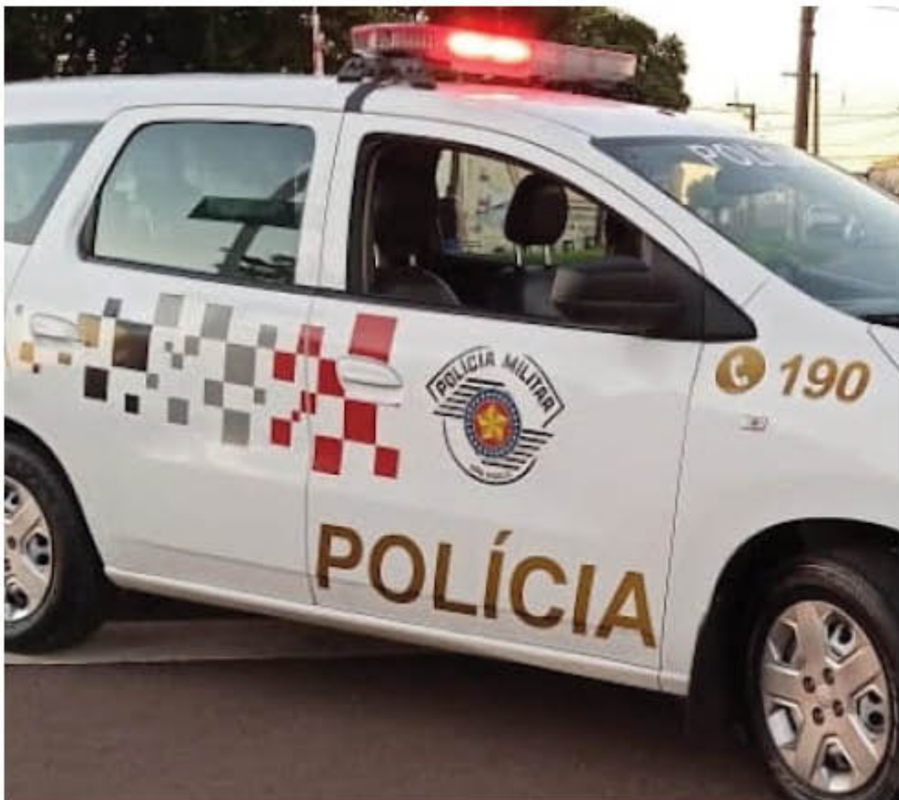
Ocorrência foi registrada pela PM nesta quinta, em Osvaldo Cruz

Devido a agressividade do autor foi necessária sua imobilização. As partes foram conduzidas ao plantão de Polícia Judiciária, ouvidas e liberadas.