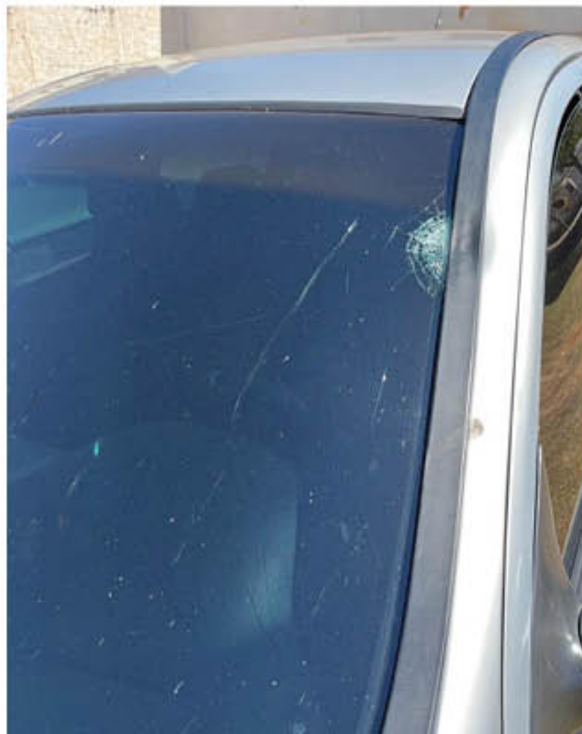
Vítima fatal tinha 37 anos

A Polícia Civil não descarta nenhuma hipótese sobre o acontecido e, apura até mesmo, um eventual caso de homicídio doloso, que é aquele em que há a intenção do autor. Contudo, como não havia mais situação flagrancial, o investigado após ser ouvido, foi liberado.