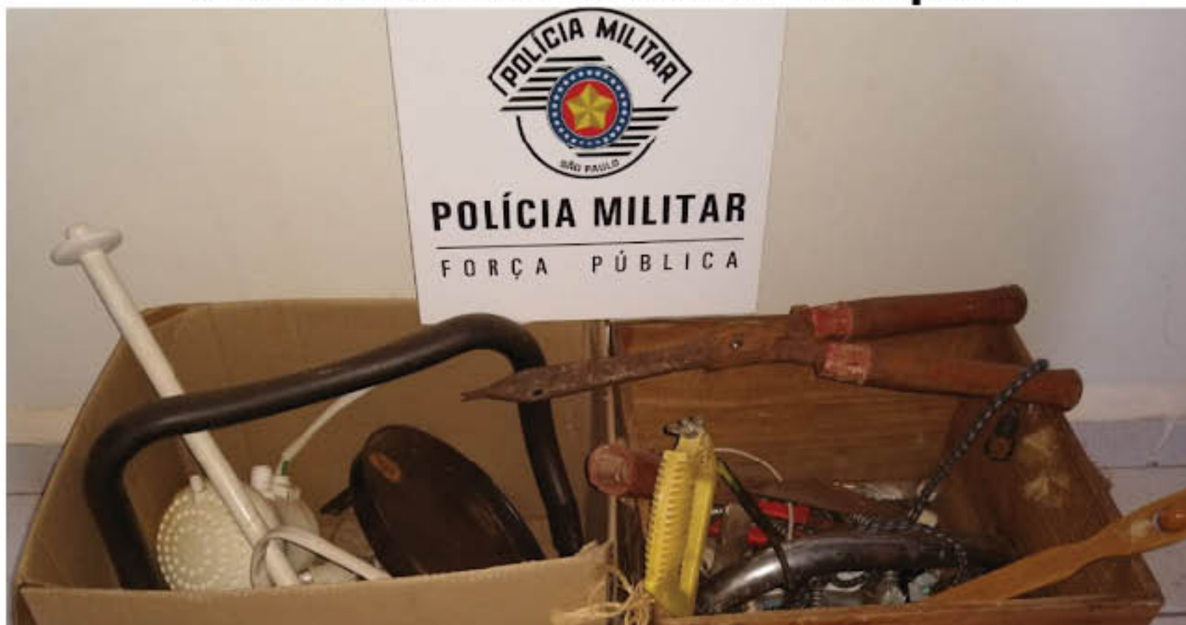
Ferramentas e utensílios da residência que foram recuperados