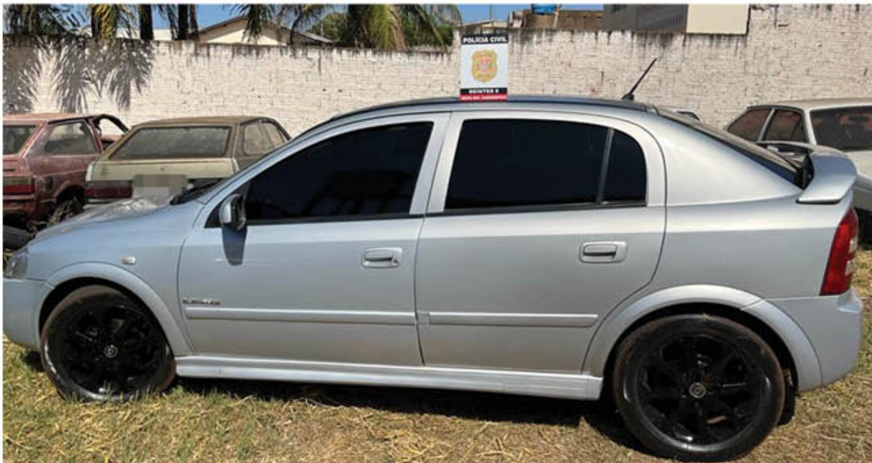
Veículo do atropelamento foi apreendido