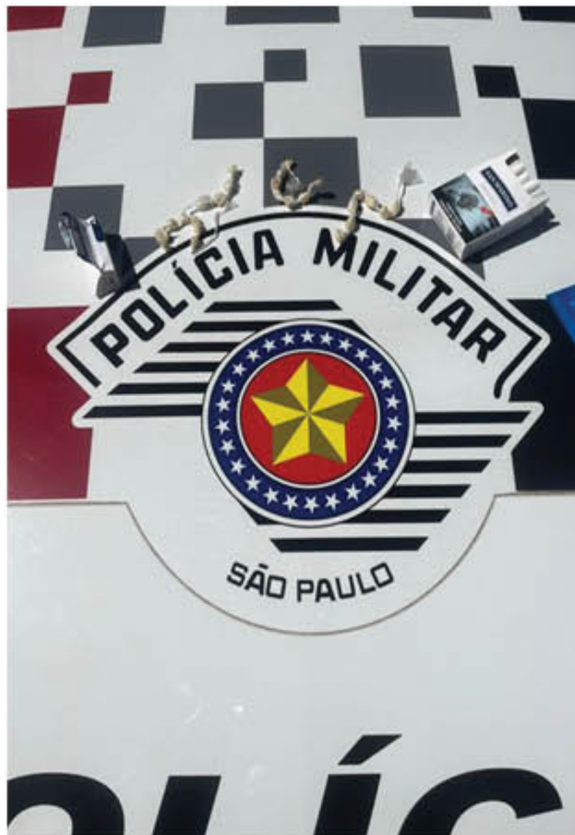
Foram apreendidos 25 papелotes de crack com o menor em Dracena

Ele foi ouvido na presença de sua mãe que acompanhou a ocorrência e posteriormente permaneceu apreendido e à disposição da Justiça, sendo apreendidos 25 papелotes de crack totalizando 0.008 kg.