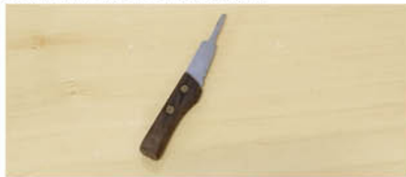
Arma branca usada pelo homem indiciado