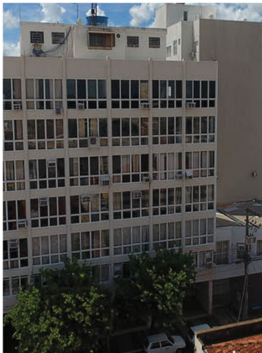
Prefeitura de Adamantina inicia consulta à população sobre a Lei Orçamentária 2024

É na LOA que estará contido o planejamento de todos os serviços e de obras que o Poder Executivo entende como prioridade para o município, sempre levando em consideração a disponibilidade de recursos.