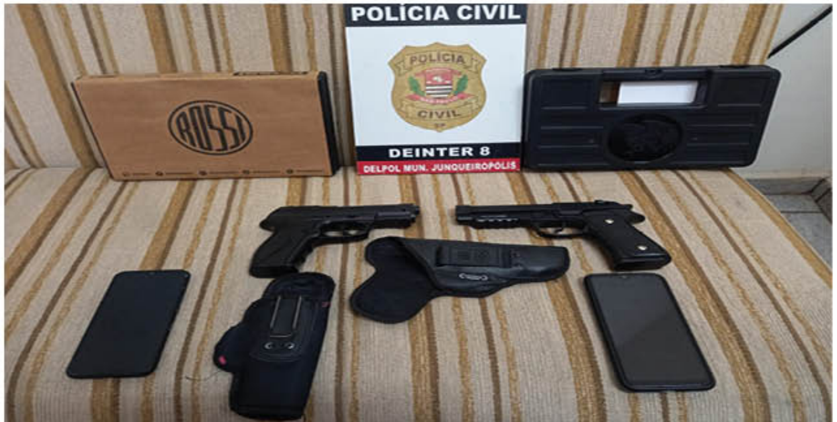
Simulacros de armas de fogo apreendidas na operação Apple da Polícia Civil