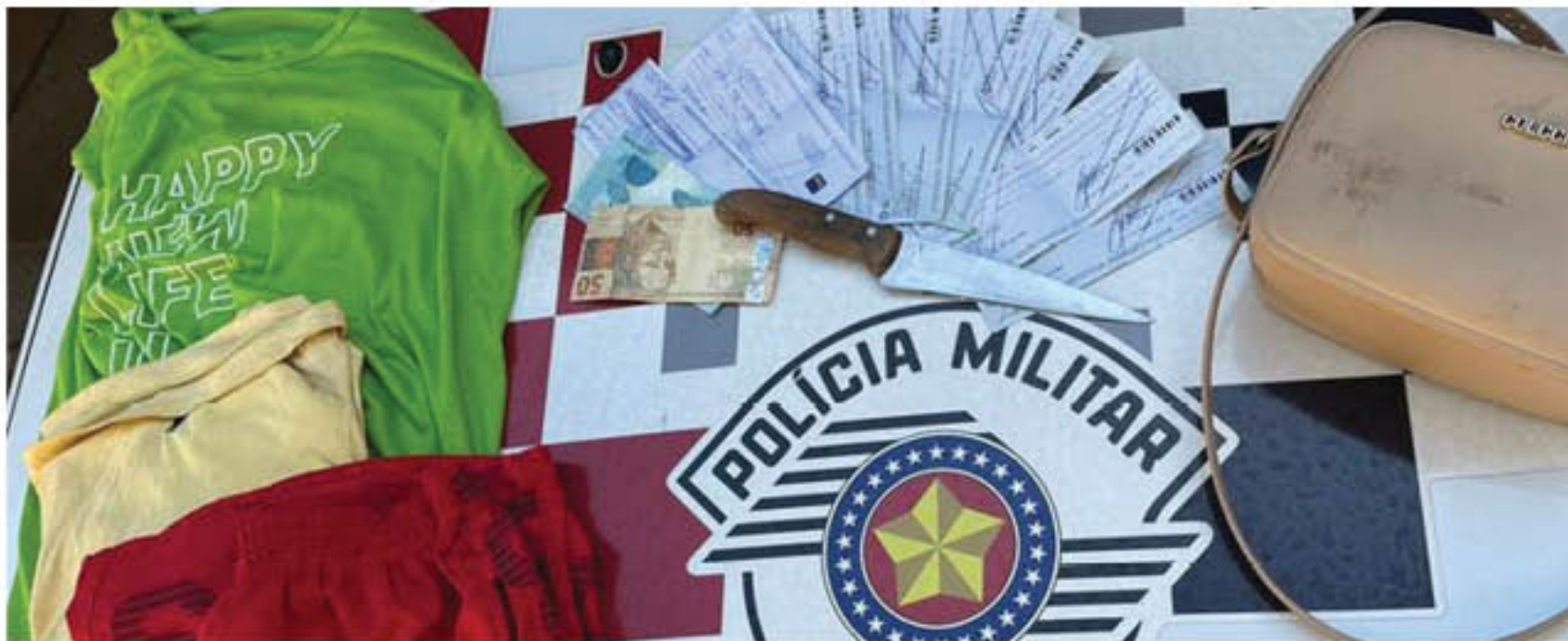
Produtos roubados foram recuperados pela PM