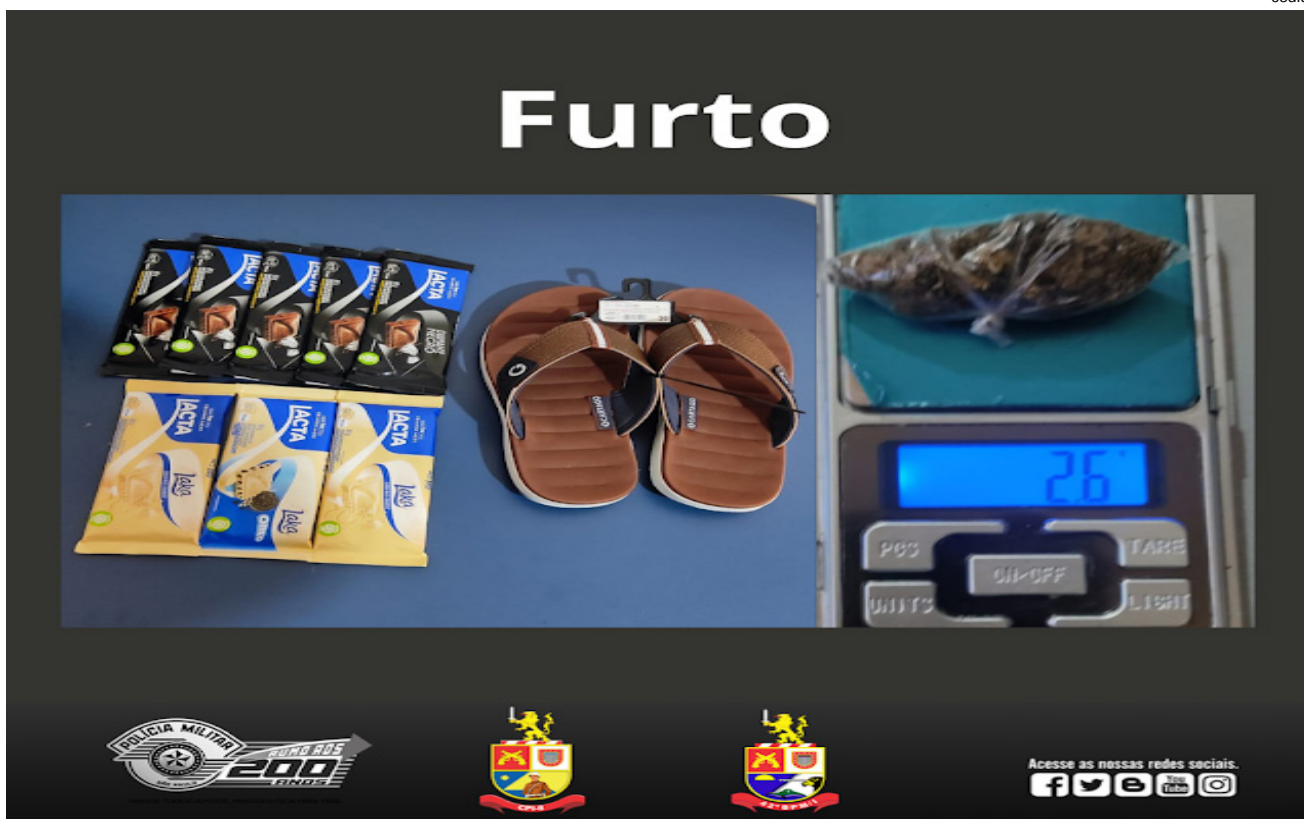
Produtos furtados foram recuperados e o acusado do furto foi preso

Nesta quinta-feira (17) policiais militares de Teodoro Sampaio efetuaram a prisão de um homem pelo crime de furto no município.