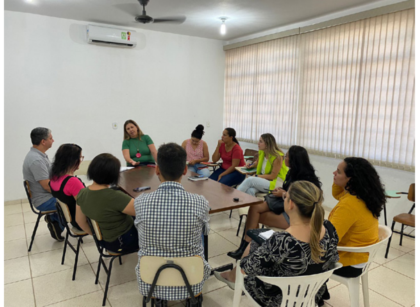
Encontro teve objetivo de organizar Feira da Mulher Empreendedora em Pacaembu