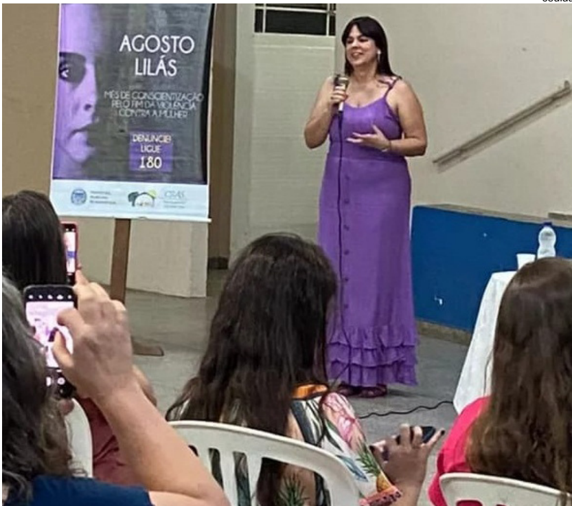
Participantes do encontro realizado em Mariápolis